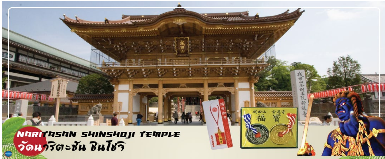
NARITASAN SHINSHOJI TEMPLE วัดนาริตะชั้น ซินไซริ

02.30 น. เhierฟ้าสู่ เมืองนาริตะ ประเทศญี่ปุ่น โดยเที่ยวบินที่ XJ602 สายการบิน AIR ASIA X ใช้เครื่องบิน AIRBUS A330-300 จำนวน 377 ที่นั่ง จัดที่นั่งแบบ 3-3-3 (น้ำหนักกระเป๋า 20 กก./ท่าน หากต้องการซื้อน้ำหนักเพิ่ม ต้องเสียค่าใช้จ่าย)