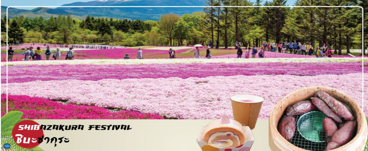
SHIBAZAKURA FESTIVAL ชิบะซากุระ

วันที่สาม เมืองยามานาชิ – หุบชิบะซากุระ – พิธีชงชาญี่ปุ่น – กรุงโตเกียว – ย่านโอไดบะ – ห้างไดเวอร์ซิตี – เมืองนาริตะ – อีออนมอลล์ นาริตะ