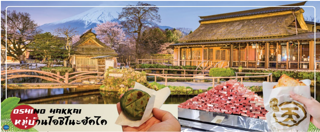
OSHINO HAKKAI หมู่บ้านโอชิโนะฮัคไก

ได้เวลาอันสมควรนำท่านเดินทางสู่ จังหวัดยามานาชิ (Yamanashi) (ใช้เวลาเดินทางประมาณ 2-3 ชั่วโมง) นำท่านเดินทางสู่ หมู่บ้านโอชิโนะฮัคไก (Oshino Hakkai) ให้ท่านเจาะลึกตามหาแหล่งน้ำบริสุทธิ์จากภูเขาไฟฟูจิ ที่เป็นแหล่งน้ำตามธรรมชาติตั้งอยู่ในหมู่บ้านโอชิโนะ จ.ยามานาชิ หรือพูดในทางกลับกันคือกลุ่มน้ำผุดโอชิโนะฮัคไก เพียงก้าวแรกที่ย่างเท้าเข้าไปในหมู่บ้านก็สัมผัสได้ถึงอากาศบริสุทธิ์ และไอเย็นจากแหล่งน้ำธรรมชาติที่มีให้เห็นอยู่ทุกมุม โดยในบ่อน้ำใสแจ๋วมีปลาหลากหลายพันธุ์แหวกว่ายอย่างสบายอารมณ์ แต่ขอบอกเลยว่าน้ำแต่ละบ่อนั้นเย็นจับใจจนแอบสงสัยว่าน้องปลาไม่หนาวสะท้านกันบ้างหรือ เพราะอุณหภูมิในน้ำเฉลี่ยอยู่ที่ 10-12 องศาเซลเซียสนอกจากชมแล้วก็ยังมีน้ำผุดจากธรรมชาติให้ดื่กดื่มตามอัธยาศัย และที่สำคัญ หมู่บ้านโอชิโนะยังเป็นแหล่งซอปปิงสินค้าโอท็อปชั้นเยี่ยมอีกด้วย