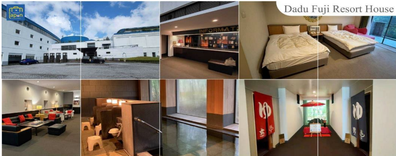
Dadu Fuji Resort House