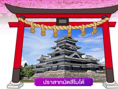
ปราสาทมัตสึโมโต้