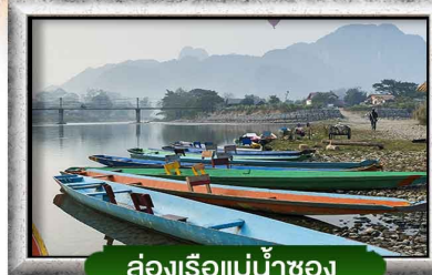
ล่องเรือแม่น้ำซอง