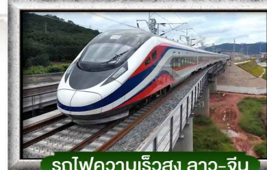
รถไฟความเร็วสูง ลาว-จีน