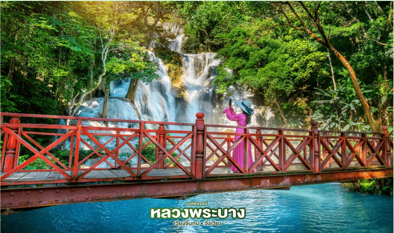
มหัสจรรย์ หลวงพระบาง เวียงจันทน์ • เวียงเวียง

นำเดินทางผ่านหมู่บ้านชนบทชมวิถีชีวิตของชาวบ้านสู่ น้ำตกตาดกวาสี (Kuang Xi Waterfall) โดยผ่านหมู่บ้านชนบทริมถนน 2 ข้างทาง เป็นหนึ่งในน้ำตกที่สวยงามที่สุดในเขตหลวงพระบาง มีแม่น้ำใสสีมรกตตลอดปี ชมความงามของน้ำตกที่ตกลงหล่นเป็นชั้นๆอย่างสวยงาม มีสะพานและเส้นทางเดินชมรอบๆ น้ำตก ใช้เวลาอิสระดื่มด่ำกับธรรมชาติ และ อิสระกับการเล่นน้ำ