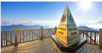
ยอดเขาฟานซิปิน