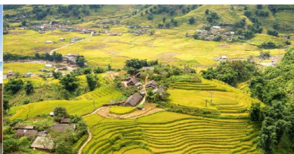
หมู่บ้านต้าฟาน