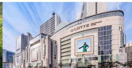
Lotte Center Hanoi

*ทางบริษัทฯ ขอสงวนสิทธิ์ในการสลับโปรแกรมทัวร์ตามความเหมาะสมขึ้นอยู่กับสถานการณ์หน้างาน โดยคำนึงถึงผลประโยชน์ของลูกค้าเป็นสำคัญ