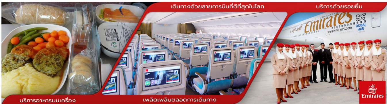
บริการอาหารบนเครื่อง

04.45 น. เดินทางถึง สนามบินนานาชาติดูไบ ประเทศสหรัฐอาหรับเอมิเรตส์ เพื่อแวะเปลี่ยนเครื่อง