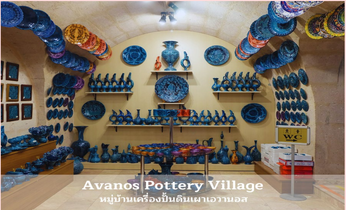
Avanos Pottery Village หมู่บ้านเครื่องปั้นดินเผาเอวานอส