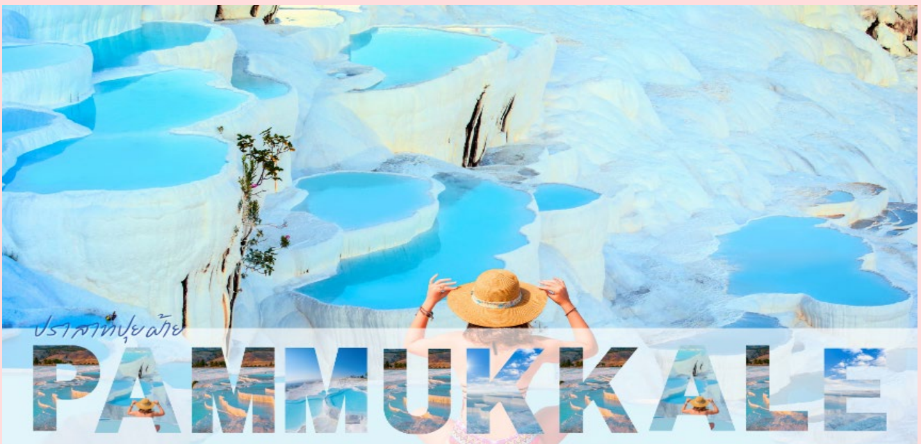
ปราสาทปูยฝ้าย

นำท่านชม ปราสาทปูยฝ้าย (PAMUKKALE) น้ำตกหินปูนสีขาวที่เกิดขึ้นจากธารน้ำใต้ดินที่มีอุณหภูมิประมาณ 35 องศาเซลเซียส ซึ่งเป็นแร่หินปูนผสมอยู่ในปริมาณที่สูงมากไหลลงมาจากภูเขา “คาลดากี” ที่ตั้งอยู่ห่างออกไปทางทิศเหนือ และทำปฏิกิริยาจับตัวแข็งเกาะกันเป็นริ้ว เป็นแอ่ง เป็นชั้น ลดหลั่นกันไปตามภูมิประเทศ เกิดเป็นประติมากรรมธรรมชาติ อันสวยงามแปลกตาที่โดดเด่นเป็นเอกลักษณ์ จนทำให้ปามุกคาเล่และเมืองเฮียราโพลิสได้รับการยกย่องจากองค์การยูเนสโกให้เป็นมรดกโลกทางธรรมชาติและวัฒนธรรมในปี ค.ศ. 1988 ชมความสวยงามของแอ่งน้ำหินปูนธรรมชาติติดกับหน้าผาที่กว้างขวางมีลักษณะสวยงามมหัศจรรย์แตกต่างออกไปมากมายคล้ายหิมะ ก่อนเมฆหรือปูยฝ้ายน้ำแร่มีอุณหภูมิประมาณ 33 - 35.5 องศาเซลเซียส อิสระเก็บภาพประทับใจจนถึงเวลาอันสมควร