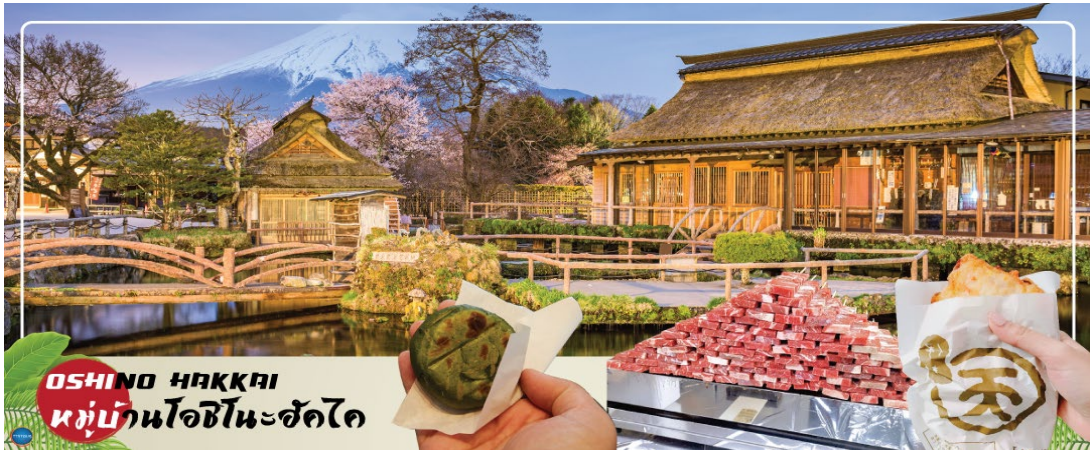
OSHINO HAKKAI หมู่บ้านโอชิโนะฮัคไค

นำท่านเข้าสู่ที่พัก (ใช้เวลาเดินทางประมาณ 20 นาที)