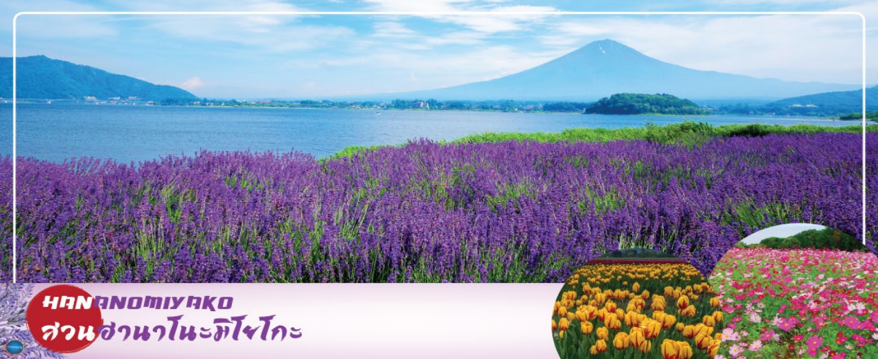
HANANOMIYAKO สวนฮานาโนะมิยาโกะ

เมืองยามานาชิ – สวนดอกไม้ฮานะโนะมิยาโกะ หรือ เทศกาลชมดอกกลาเวนเดอร์ที่ทะเลสาบคาวากุจิ (ตามฤดูกาล) – พิพิธภัณฑ์ญี่ปุ่น – กรุงโตเกียว – ย่านโอไดบะ – ห้างไดเวอร์ซิตี – เมืองนาริตะ – อีออนมอลล์ นาริตะ