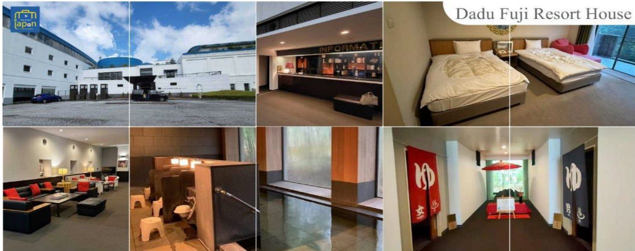
Dadu Fuji Resort House

DADU FUJI RESORT HOUSE, YAMANAKAKO หรือระดับเดียวกัน รับประทานอาหารค่ำ ณ ภัตตาคาร ของโรงแรม (2) พิเศษ!! อิมอรอยกับ บุฟเฟต์ซาบู หลังอาหารให้ท่านได้ผ่อนคลายกับการแช่น้ำแร่ธรรมชาติ เชื่อว่าถ้าได้แช่น้ำแร่แล้ว จะทำให้ ผิวพรรณสวยงามและช่วยให้ระบบหมุนเวียนโลหิตดีขึ้น