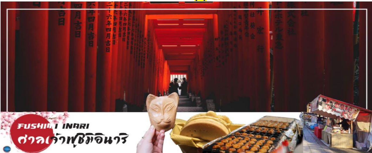
FUSHIMI INARI ศาลเจ้าฟูชิมิอินาริ

จากนั้นนำท่านสู่ ศาลเจ้าฟูชิมิอินาริ (Fushimi Inari Shrine or Fushimi Inari Taisha) ศาลเจ้าเสาโทริอิพันต้นแห่งเกียวโต (จริงๆมีเป็นหมื่นๆ ต้น) หรือที่คนไทยชอบเรียกกันว่า ศาลเจ้าจิ้งจอก หรือ ศาลเจ้าแดง เป็นศาลเจ้าชินโตสร้างถวายเป็นเทพอินาริ ซึ่งเป็น เทพแห่งพืชพันธุ์ธัญญาหารของ