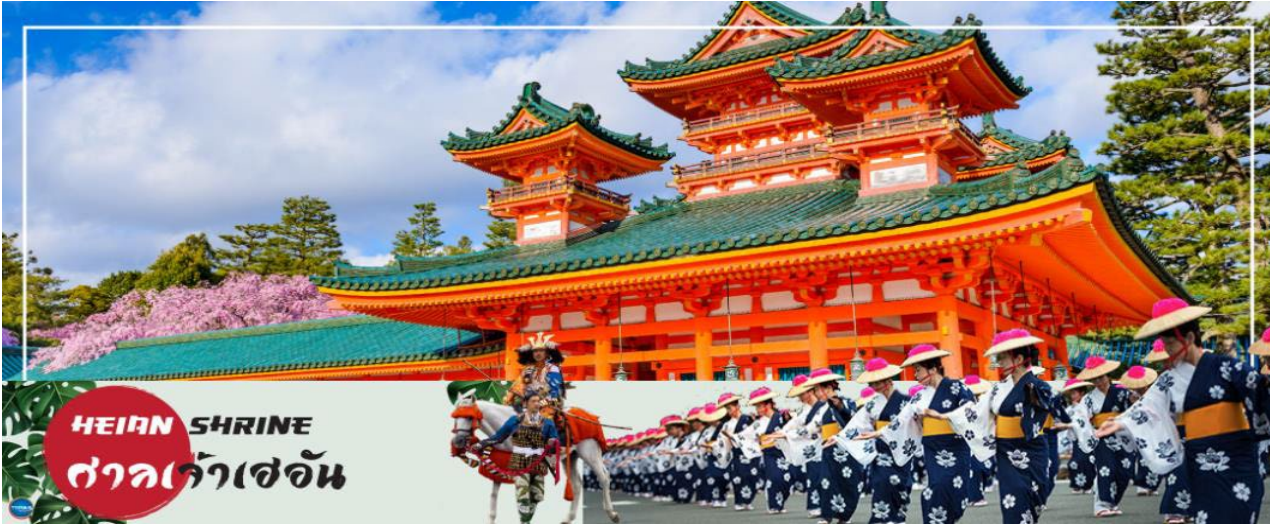
HEIAN SHRINE ศาลเจ้าเฮอัน

เมืองนาโกย่า - เมืองเกียวโต - ศาลเจ้าเฮอัน - การเรียนพิธีชงชาญี่ปุ่น - ศาลเจ้าฟูชิมิอินาริ - เมืองโอซาก้า - LALAPORT & MITSUI OUTLET PARK OSAKA KADOMA