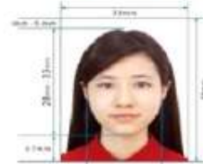
35mm x 45mm Paper Photo for Visa Application Form