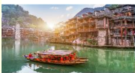
เมืองเฟิ่งหวง