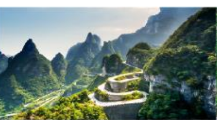
จางเจียเจีย