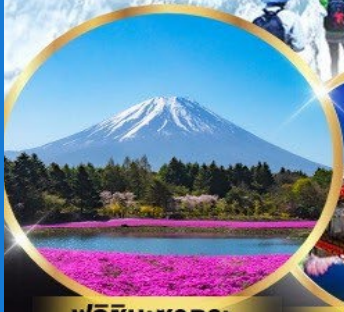
ฟูจิซึบะซาทุระ