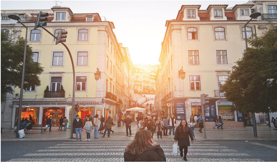
คำ พักที่ บริการอาหาร ณ ภัตตาคาร เมนูอาหารท้องถิ่น HOLIDAY INN HOTEL , LISBON ระดับ 4 ดาวหรือเทียบเท่า