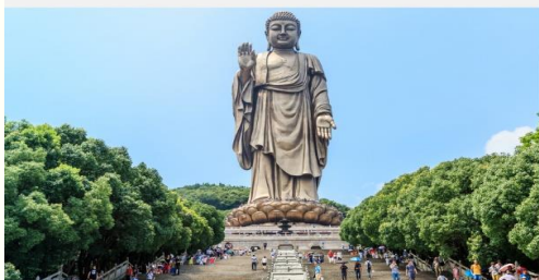
พระใหญ่หลิงซานต้าฝอ