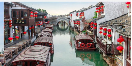
ถนนโบราณชานทางเจีย

*ทางบริษัทฯ ขอสงวนสิทธิ์ในการสลับโปรแกรมทัวร์ตามความเหมาะสมขึ้นอยู่กับสถานการณ์หน้างาน โดยคำนึงถึงผลประโยชน์ของลูกค้าเป็นสำคัญ