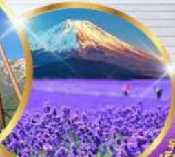
ไอชิชิ ปาร์ค