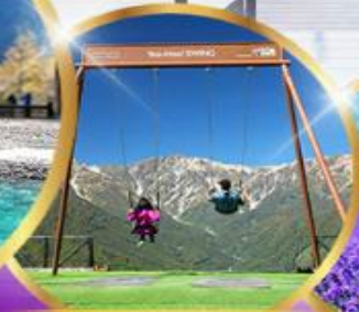
ชิงช้า Yoo hoo! Swing