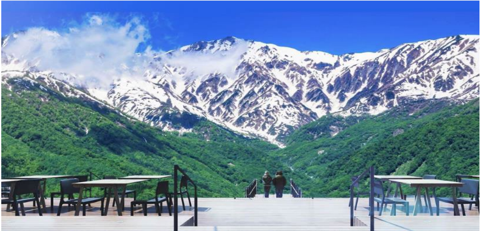
HAKUBA MOUNTAIN HARBOR

ไม่พลาดกับการชมวิวแบบพาโนรามา ณ Hakuba Mountain Harbor ด้วยทัศนียภาพที่เหนือชั้นของภูเขาโดยรอบ จุดเด่น คือ ระเบียง “Hakuba Sanzan” ที่สามารถเห็นเทือกเขาแอลป์แบบ 360 องศา ได้อย่างสวยงามในทุกฤดู สามารถยืนถ่ายรูป และดื่มด่ำกับบรรยากาศได้อย่างเต็มอิม ในบริเวณเดียวกันยังมีร้านเบเกอรี่ โดยทางเข้ามีที่นั่งบนระเบียง สามารถเพลิดเพลินไปกับการจิบเครื่องดื่มอุ่น ๆ พร้อมชมบรรยากาศตามอัธยาศัย