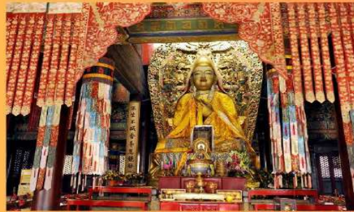
องค์จางโป