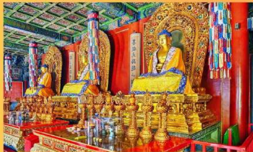
พระพุทธเจ้า 3 พระองค์