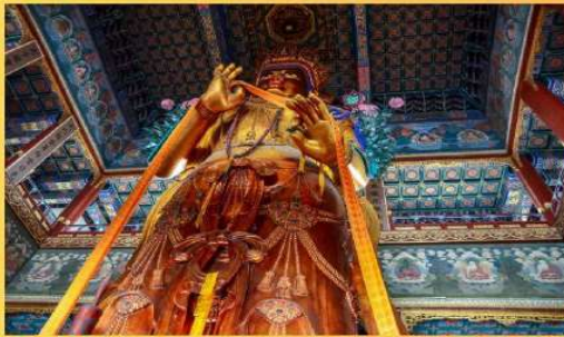
พระศรีอริยเมตไตรย