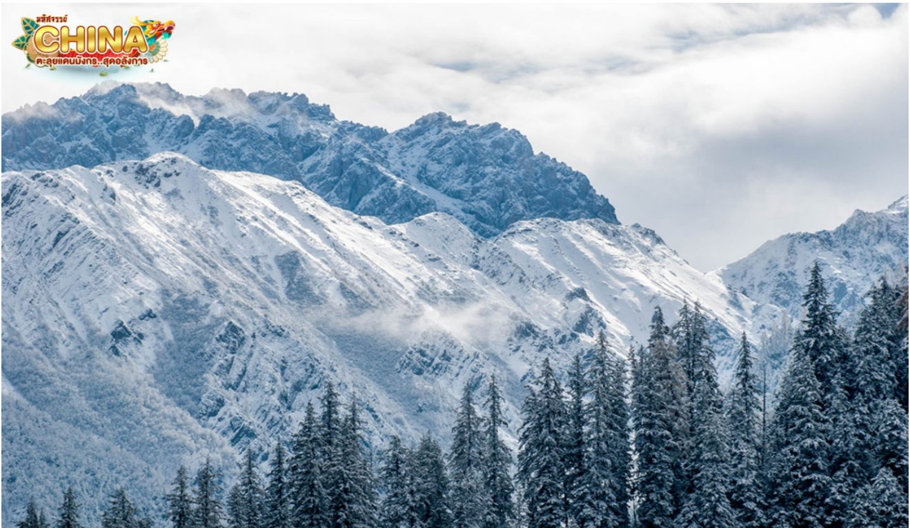
สถานที่ท่องเที่ยวที่อยู่ในอุทยานแห่งชาติจิวจ้ายโกว

นำท่านเดินทางสู่ อุทยานแห่งชาติจิวจ้ายโกว (โดยรถของอุทยาน) เพื่อชมมรดกโลกอุทยานแห่งชาติธารสวรรค์ “จิวจ้ายโกว” หนึ่งในมรดกโลกทางธรรมชาติของประเทศจีนที่ขึ้นชื่อเรื่องความสวยงามของภูเขา ลำธาร น้ำตก และทะเลสาบ ตั้งอยู่สูงกว่าระดับน้ำทะเลถึง 2,500 เมตร ภายในอาณาบริเวณอุทยานจิวจ้ายโกวประกอบด้วยภูเขาและหุบเขาอันสลับซับซ้อน เนื่องจากพื้นที่ส่วนใหญ่มีระดับพื้นดินที่ลดหลั่นจึงทำให้เกิดแอ่งน้ำน้อยใหญ่มากมาย ทั้งกลุ่มน้ำตกใหญ่น้อยและแม่น้ำ ซึ่งไหลมาจากหุบเขารวม 5 สาย ในยามฤดูใบไม้เปลี่ยนสีนั้น สีสนของทะเลสาบแห่งนี้จะเต็มไปด้วย สีแดง สีส้ม สีเหลือง ของใบไม้ที่ปลิวปลิวร่วงหล่นลงไปทะเลสาบ หากเป็นช่วงฤดูหนาวก็จะถูกปกคลุมไปด้วยหิมะให้บรรยากาศที่สวยงามไปในอีกรูปแบบหนึ่ง จนได้รับฉายาว่า “ดินแดนแห่งเทพนิยาย” (หมายเหตุ: ราคารวมรถอุทยานแล้ว (รถเวียน) หากต้องการเช่ารถแบบส่วนตัวทั้งกรุ๊ป ต้องชำระเพิ่มกับทางไกด์ท้องถิ่นหรือหัวหน้าทัวร์)