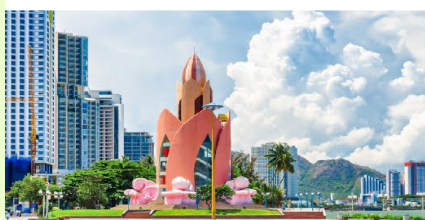
Tram Huong Tower