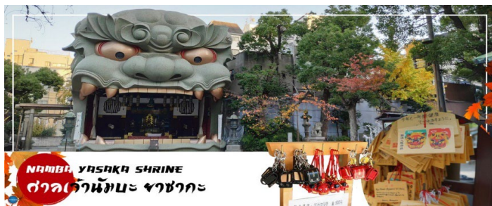
NAMBA YASAKA SHRINE ศาลเจ้านัมมะ ยะซะกะ

รูปปั้นหน้าสิงโตอัปาคขนาดใหญ่ ที่เชื่อกันว่า สามารถกลืนกินปีศาจร้าย หรือ สิ่งไม่ดีทั้งหลาย ให้หายไป และนำพามาซึ่งความโชคดีให้แก่ผู้คน ปัจจุบันนักเรียน นักศึกษา และผู้ประกอบการธุรกิจนั้น นิยมมาขอพรให้ประสบความสำเร็จกันที่นี่ ด้วยความสูง 17 เมตร ความกว้าง 11 เมตรและความลึก 7 เมตร อีสระให้ทุกท่านสักการะ และเก็บภาพที่ ศาลเจ้านัมมะ ยะซะกะ