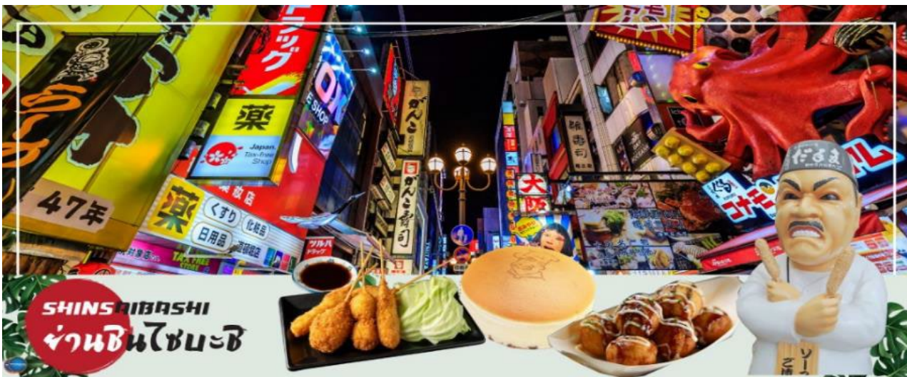
SHINSAIBASHI ย่านชินไซบาชิ

จากนั้นอีสระช้อปปิ้ง ย่านชินไซบาชิ (Shinsaibashi) บริเวณแหล่งช้อปปิ้งแห่งนี้มีความยาวประมาณ 600 เมตร เต็มไปด้วยร้านค้าปลีก ร้านแฟชั่นร้านเครื่องสำอางค์ ร้านรองเท้า กระเป๋า นาฬิกา ร้านกาแฟ ร้านอาหาร ร้านขนม ร้านเสื้อผ้าสตรีทแบรนด์ทั้งญี่ปุ่นและต่างประเทศ เช่น Zara H&M Beans ABC Mart เป็นต้น เรียกว่ามีทุกอย่างที่ต้องการรวมกันอยู่บริเวณนี้ ใกล้กันท่านสามารถเดินไปยัง ย่านโดทงโบริ (Dotonbori) ย่านบันเทิงยามค่ำคินตลอดแนวถนนเลียบบคลองโดทงโบริ จากสะพานโดทงโบริบาชิไปจนถึงสะพานนิปปอนบาชิ ไฮไลท์!!! ใครๆ ก็เช็คอิน ถ่ายภาพคู่ ป้ายกูลิโกะแมน หรือ ป้ายโดทงโบริกูลิโกะ (Dotonbori Glico Sign) เป็นป้ายไฟนีออนรูปนักกรีฑากำลังวิ่งอยู่บนลู่วิ่ง ซึ่งถูกติดตั้งมาตั้งแต่ ปี ค.ศ.1935 นอกจากนี้ยังมีอีกหนึ่งสัญลักษณ์สถานที่นัดพบกันหลง นั่นก็คือ ร้านปูคานิดอรากุ (Kani Doraku) ซึ่งมีปูยักษ์ขยับแขนและลูกตาได้อีกด้วย และห้ามพลาดสำหรับ ทาโกะยากิ อาหารท้องถิ่นของชาวโอซาก้า ที่มาถึงถิ่นแล้วต้องลอง Original Taste รับรองไม่ผิดหวังแน่นอน