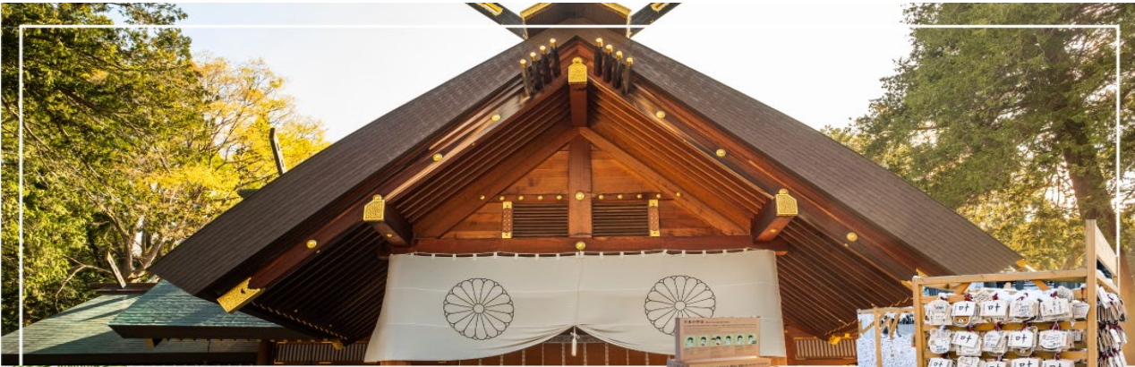
HOKKAIDO SHRINE ศาลเจ้าฮอกไกโด

นำท่านเดินทางสู่ ย่านซุซุกิโนะ(Susukino) นับเป็นย่านที่เต็มไปด้วยแหล่งบันเทิงที่โด่งดังมากที่สุดของเมืองซัปโปโร(Sapporo) อีกทั้งยังเรียกได้ว่าเป็นย่านบันเทิงที่ใหญ่ที่สุดในทางตอนเหนือของญี่ปุ่นทีเดียวละคะ บอกเลยว่าอยากมาบันเทิงใจยามค่ำคืนสัมผัสไลฟ์สไตล์แบบคนญี่ปุ่นแท้ๆ ต้องมาที่นี่ให้ได้เลยละคะ เพราะเต็มไปด้วยร้านค้า บาร์ ร้านอาหาร ร้านคาราโอเกะ และตุ๋ปาลังโกะ รวมกว่า 4,000 ร้าน บางร้านนี้เปิดจนถึงเที่ยงเที่ยงคืน