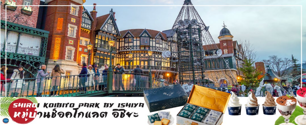
SHIROI KOIBITO PARK BY ISHIYAMA หมู่บ้านช็อคโกแลต อิชียะ

โกแลตที่ขึ้นชื่อที่สุดของที่นี่คือ Shiroi Koibito ซึ่งมีความหมายว่าช็อคโกแลตชาวแต่คนรัก ท่านสามารถเลือกซื้อกลับไปให้คนที่ท่านรักทานหรือว่าซื้อเป็นของขวัญฝากติดไม้ติดมือกลับบ้านก็ได้ นอกจากนี้ท่านจะได้เลือกซื้อช็อคโกแลตที่หาซื้อที่ไหนไม่ได้ และ ท่านก็ยังจะได้ชมประวัติความเป็นมาของโรงงาน และการผลิตช็อคโกแลตอีกด้วย