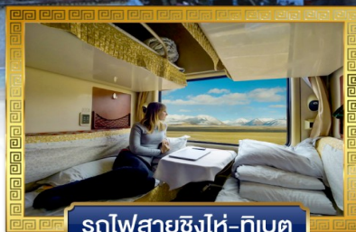
รถไฟสายชิงไห่-ทิเบต