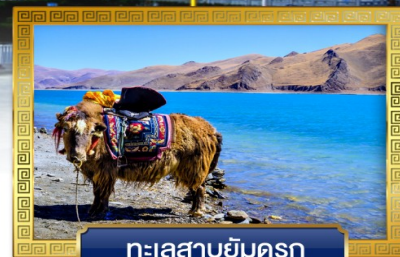
ทะเลสาบยัมดรก

เดินทางโดย: สายการบินบลัคก็แอร & ไซนำอิสกัรึนแอรไลน