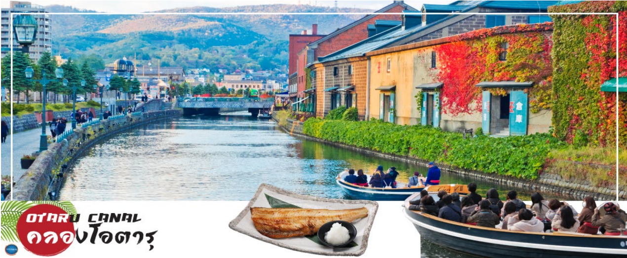
OTARU CANAL คลองโอตารุ

เมืองซัปโปโร – ดิวตี้ฟรี – เมืองโอตารุ – คลองโอตารุ – พิพิธภัณฑ์กล่องดนตรี – เมืองซัปโปโร – ศาลเจ้าซอกไกโด – ซ้อปปิงทานุกิโดจิ