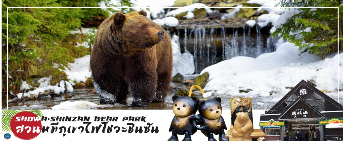
SHOWA-SHINZAN BEAR PARK สวนหมีภูเขาไฟโชวะชินซัน

รับประทานอาหารกลางวันเป็น เบนโตะบนบัส เพื่อความรวดเร็วในการเดินทาง (1)