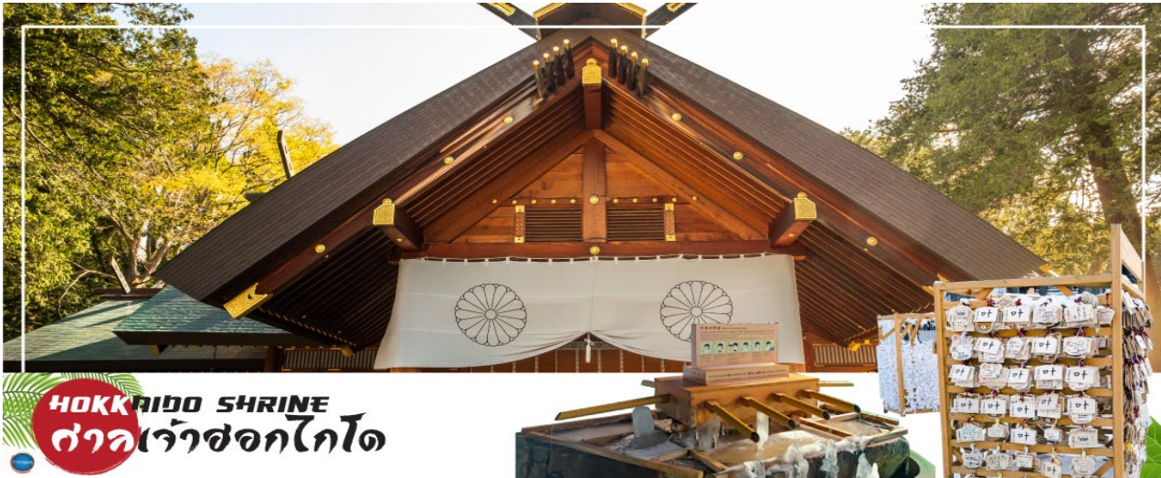
HOKKAIDO SHRINE ศาลเจ้าซอกไกโด

จากนั้นนำท่านเดินทางสู่ เมืองซัปโปโร (SAPPORO) (ใช้เวลาเดินทางประมาณ 1.20 ชั่วโมง) นำท่านขอพร ศาลเจ้าซอกไกโด (Hokkaido Shrine) หรือเดิมชื่อ ศาลเจ้าซัปโปโร เปลี่ยนเพื่อให้สมกับ ความยิ่งใหญ่ของเกาะเมืองซอกไกโด ศาลเจ้าชินโตนี้คอยปกป้องรักษา ให้ชนชาวเกาะซอกไกโดมีความสุขถึงแม้จะไม่ได้มีประวัติศาสตร์อันยาวนาน