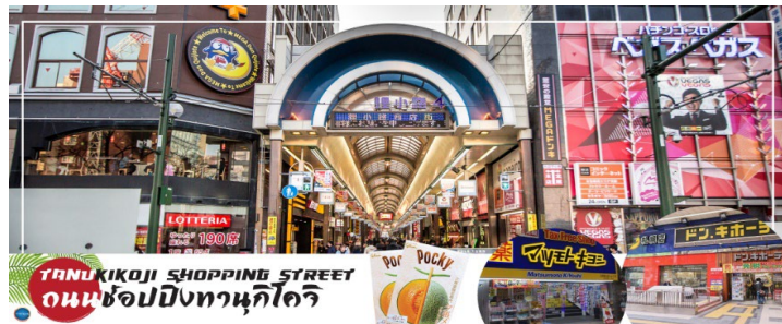
TANUKIKOJI SHOPPING STREET ถนนช้อปปิ้งทานุกิโคจิ

จากนั้นนำท่านสู่ ถนนช้อปปิ้งทานุกิโคจิ (Tanukikoji Shopping Street) เป็นย่านการค้าเก่าแก่ของเมืองซัปโปโร โดยมีพื้นที่ทั้งหมด 7 บล็อก ภายในนอกจากจะเป็นแหล่ง รวมร้านค้าต่างๆ อย่างร้านขายกิโมโน เครื่องดนตรี วิดีโอ โรงภาพยนตร์ แล้ว ยังมีร้านอาหารมากมาย ทั้งยังเป็นศูนย์รวมของเหล่าวัยรุ่นด้วย เนื่องจากมีเกมเซินเตอร์และตู้หนีบตุ๊กตามากมาย ร้านดองกิ ร้าน 100 เยน นอกจากนี้ที่นี่ยังมีการตกแต่งบนหลังคาด้วยตุ๊กตาทานุกิขนาดใหญ่ และเนื่องจากร้านค้าส่วนใหญ่มีหลังคาคลุม ดังนั้น ไม่ต้องกังวลเรื่อง ฝนหรือหิมะ ท่านสามารถช้อปปิ้งได้อย่างเพลิดเพลิน