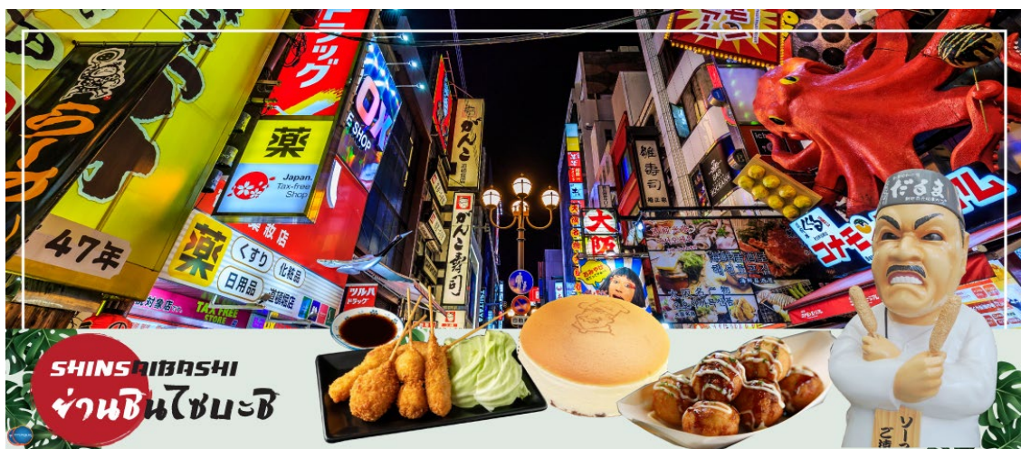
เย็น อิสระรับประทานอาหารเย็นตามอัธยาศัย

จากนั้นอิสระช้อปปิ้ง ย่านชินไซบาชิ (Shinsaibashi) (ใช้เวลาเดินทางประมาณ 1 ชั่วโมง) บริเวณแหล่งช้อปปิ้งแห่งนี้มีความยาวประมาณ 600 เมตร เต็มไปด้วยร้านค้าปลีก ร้านแฟชั่นร้านเครื่องสำอางค์ ร้านรองเท้า กระเป๋า นาฬิกา ร้านกาแฟ ร้านอาหาร ร้านขนม ร้านเสื้อผ้าสตรีทแบรนด์ทั้งญี่ปุ่นและต่างประเทศ เช่น Zara H&M Beans ABC Mart เป็นต้น เรียกว่ามีทุกอย่างที่ต้องการรวมกันอยู่บริเวณนี้ ใกล้กันท่านสามารถเดินไปยัง ย่านโดทงโบริ (Dotonbori) ย่านบันเทิงยามค่ำ คึกคักตลอดแนวถนนเลียบบคลองโดทงโบริ จากสะพานโดทงโบริมาชิไปจนถึงสะพานนิปปอนบาชิ ไฮไลท์!!! ใครๆ ก็เชคอิน ถ่ายภาพคู่ ป้ายกูลิโกะแมน หรือ ป้ายโดทงโบริกูลิโกะ (Dotonbori Glico Sign) เป็นป้ายไฟนีออนรูปนักกรีฑากำลังวิ่งอยู่บนลู่วิ่ง ซึ่งถูกติดตั้งมาตั้งแต่ ปี ค.ศ.1935 นอกจากนี้ยังมีอีกหนึ่งสัญลักษณ์สถานที่นัดพบกันหลง นั่นก็คือ ร้านปูคานิดอรากุ (Kani Doraku) ซึ่งมีปูยักษ์ขยับแขนและลูกตาได้อีกด้วย และห้ามพลาดสำหรับ ทาโกยากิ อาหารท้องถิ่นของชาวโอซาก้า ที่มาถึงถิ่นแล้วต้องลอง Original Taste รับประทานไม่ผิดหวังแน่นอน