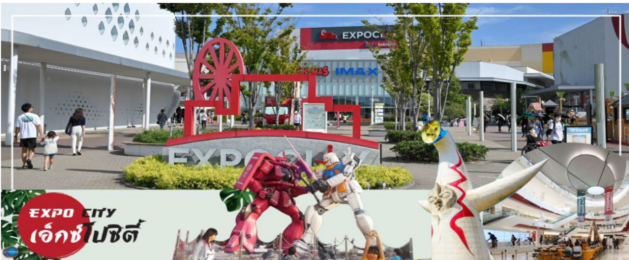
EXPO CITY เอ็กซ์โปซิติ

เดินทางสู่ เมืองโอซาก้า (Osaka) (ใช้เวลาเดินทางประมาณ 1 ชั่วโมง) เมืองที่มีขนาดเศรษฐกิจใหญ่เป็นอันดับ 2 และมีประชากรมากเป็นอันดับ 3 ของประเทศญี่ปุ่น ตั้งอยู่ในภาคคันไซบนเกาะฮนชู ประเทศญี่ปุ่น ปัจจุบันเมืองโอซาก้ามีสถานที่ท่องเที่ยวมากมาย มีแหล่งช้อปปิ้งยอดนิยม มีสวนสนุกขนาดใหญ่ ทั้งยังมีอาหารที่เป็นเอกลักษณ์ เช่น ทาโกะยากิ โอโคโนมียากิ (พิซซ่าญี่ปุ่น) และ คุชิด้ตสึ