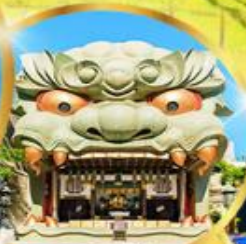
ศาลเจ้า นัมมะ ยาชากะ