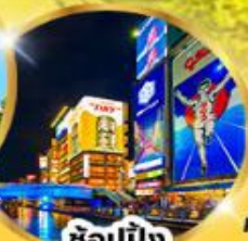
ช้อปปิ้ง ชินไซบาชิ