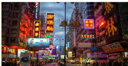
จิมซาจุ่ย