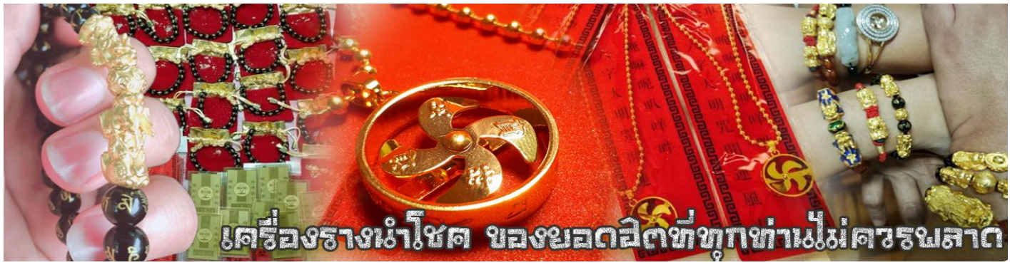
เครื่องรางนำโชค ของยอดฮิตที่ทุกท่านไม่ควรพลาด