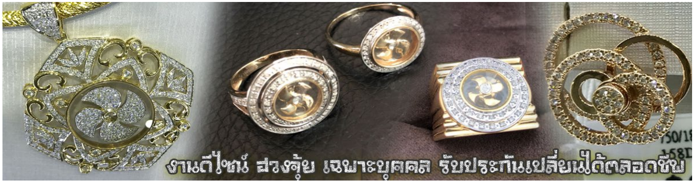
งานดีไซน์ สวยหรู เหมาะบุคคล รับประกันแบบสั่งไม่ผิดหวัง

นำท่านเยี่ยมชม โรงงานจิวเวลรี่ ที่ขึ้นชื่อของฮ่องกงพบกับงานดีไซน์ที่ได้รับรางวัลอันดับยอดเยี่ยม และใช้ในการเสริมดวงเรื่อง ฮวงจุ้ยนำความโชคดี มั่งมั่งแก่ผู้สวมใส่ ซึ่งในเมืองไทยก็ได้นิยมแพร่หลายออกไป ไม่กว่าจะเป็นกลุ่ม ดารา นักการเมือง พ่อค้าแม่ขายที่ประกอบธุรกิจ เจ้าของกิจการห้างร้านต่าง ๆ ซึ่งเชื่อกันว่าจะนำสิ่งดี ๆ ปัดเป่าสิ่งชั่วร้ายให้กับบุคคลที่สวมใส่ ซึ่งจะมีมากมายหลายชนิด เช่น จี้กั๊กหัน แหวนรุ่งต่าง ๆ นาฬิกาข้อมือ (ซึ่งผู้สวมใส่จะได้รับการดูอายุมือจากซินเซประจำร้าน เพื่อนำวิธีการเสริมดวงในการสวมใส่โดยไม่ติดต่อบริการ)