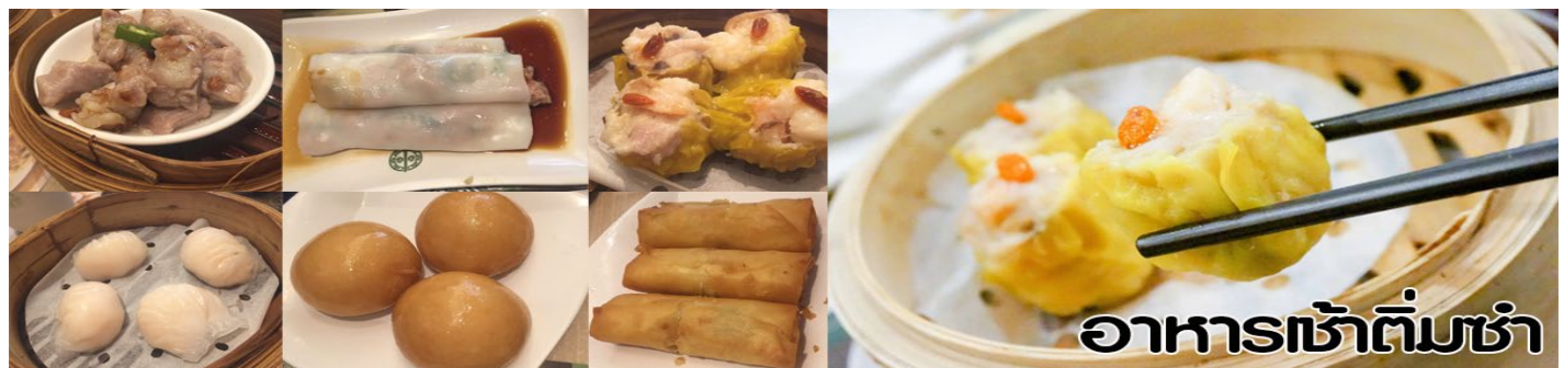
อาหารเช้าติ่มซ่า