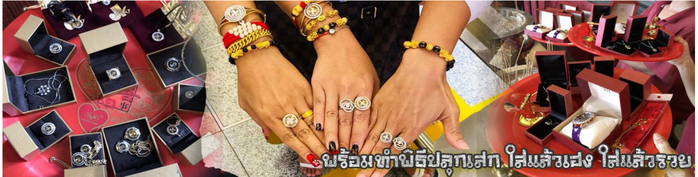
มาร่วมทำพิธีปลุกเสก ใส่แล้วเผง ใส่แล้วรวย

นำท่านเยี่ยมชม โรงงานจิวเวลรี่ ที่ขึ้นชื่อของฮ่องกงพบกับงานดีไซน์ที่ได้รับรางวัลอันดับยอดเยี่ยม และใช้ในการเสริมดวงเรื่อง ฮวงจุ้ยนำความโชคดี มั่งมั่งแก่ผู้สวมใส่ ซึ่งในเมืองไทยก็ได้นิยมแพร่หลายออกไป ไม่กว่าจะเป็นกลุ่ม ดารา นักการเมือง พ่อค้าแม่ขายที่ประกอบธุรกิจ เจ้าของกิจการห้างร้านต่าง ๆ ซึ่งเชื่อกันว่าจะนำสิ่งดี ๆ ปัดเป่าสิ่งชั่วร้ายให้กับบุคคลที่สวมใส่ ซึ่งจะมีมากมายหลายชนิด เช่น จี้กั๊กหัน แหวนรุ่งต่าง ๆ นาฬิกาข้อมือ (ซึ่งผู้สวมใส่จะได้รับการดูอายุมือจากซินเซประจำร้าน เพื่อนำวิธีการเสริมดวงในการสวมใส่โดยไม่ติดต่อบริการ)