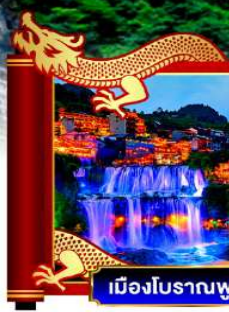
เมืองโบราณฟูหรงเจิน