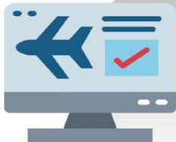
การจองทัวร์: