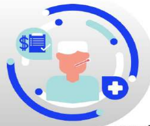
กรณีเจ็บป่วย:

กรณีเจ็บป่วยจนไม่สามารถเดินทางได้ ต้องมีใบรับรองแพทย์จากโรงพยาบาล บริษัทฯ จะทำการเลื่อนการเดินทางของท่านไปยังคณะต่อไป ทั้งนี้ ท่านจะต้องเสียค่าใช้จ่ายที่ไม่สามารถยกเลิก หรือเลื่อนการเดินทางได้ตามความเป็นจริง