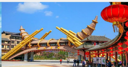
Dishui Miao cheng

*ทางบริษัทฯ ขอสงวนสิทธิ์ในการสลับโปรแกรมทัวร์ตามความเหมาะสมขึ้นอยู่กับสถานการณ์หน้างาน โดยคำนึงถึงผลประโยชน์ของลูกค้าเป็นสำคัญ