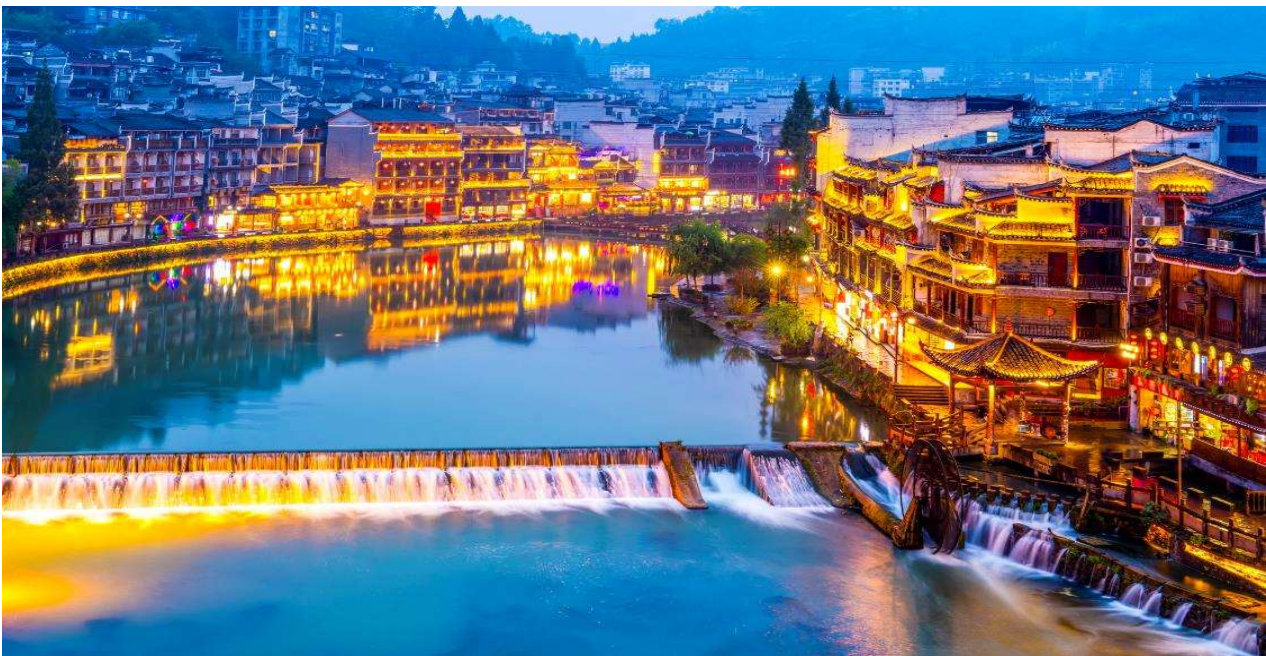
T2G-CSX05VZ ฉางซา จางเจียเจีย ฟู่หงเจิ้น เฟิ่งหวง สะพานแก้ว ชมโชว์นางจิ้งจอกขาว 5D 4N (vz)

ฝีมือทั้งของจริงของปลอม อยู่ตามแผงลอยริมทางริมน้ำ นำท่าน ล่องเรือแม่น้ำถั่วเจียง เปลี่ยนชมบรรยากาศให้ท่านได้ชมบ้านเรือนและร้านค้าตลอดสองฝั่งแม่น้ำ ให้ท่านชม เมืองโบราณเฟิ่งหวง ในบรรยากาศช่วงยามค่ำ ที่เมืองโบราณแห่งนี้ประดับด้วยแสงไฟ และตลอดสองข้างทางจะมีร้านค้ามากมาย เช่น ร้านปิ้งย่าง ร้านขายเหล้าเหมาโต ให้ท่านได้เลือกชิม เลือกซื้อ