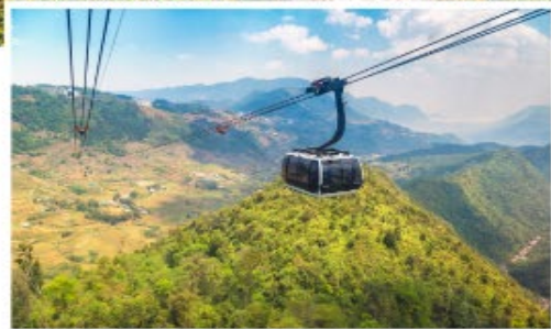
ขึ้นกระเช้ายอดฟานซีปัน