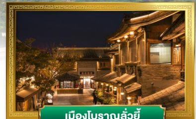
เมืองโบราณลั่วอี้