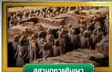
สุสานทหารดินเผา