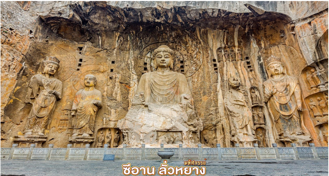
มหัสีรวิธาน เซียน ลั่วหยาง

จากนั้น ชมความมหัศจรรย์ ถ้ำผาลงเหมิน (รวมรถแบริดเตอร์) หรือถ้ำหินประตูมังกร กลุ่มถ้ำบนหน้าผาที่แสดงถึงพุทธศิลป์สุดประณีตยุคแรกในจีน ถ้ำมีความยาวจากทิศเหนือจรดใต้ประมาณ 1 กิโลเมตร จัดเป็น 1 ใน 3