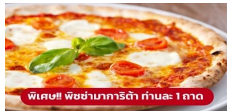
พิเศษ!! พิซซ่ามาการิตต้า ท่านละ: 1 ถาด

นำท่านเก็บภาพความประทับใจและถ่ายรูป 1 ใน 7 สิ่งมหัศจรรย์ของโลก หอเอนปิซ่า (Leaning Tower of Pisa) หอเอนปิซ่าที่สร้างขึ้นเพื่อเป็นหอรระฆังแห่งวิหารประจำเมือง แต่เพียงการเริ่มต้นของการสร้างถึงบริเวณชั้น 3 ก็เกิดการทรุดตัวและต้องหยุดการก่อสร้างจนถัดมาอีก 100 ปี ถึงได้สร้างต่อจนเสร็จสมบูรณ์ มหาวิหารปิซ่า (Cathedral of Pisa) มหาวิหารที่สวยงามที่สุดในลักษณะโรมันเนสก์ แสดงให้เห็นจากชายหอคีลุ่ม กลางตัวมหาวิหาร และชาวหอรระฆัง ตัวมหาวิหารเป็นผังกางเขน มีมุขท้ายวัดและตกแต่งซุ้มโค้งรอบวัดภายนอกเป็นแบบแถบหินอ่อน สลับสีทางขวาง ซึ่งกลายมาเป็นแบบที่เรียกว่า "ลักษณะปิซ่า" และโดมรูปไข่และ Pisa Baptisty of St. John เป็นอาคารทางศาสนาคริสต์นิกายโรมันคาทอลิก จากนั้นนำท่านเดินทางสู่ เมืองมิลาน (Milan) (ระยะทาง 282 ก.ม. / 4 ชั่วโมง)