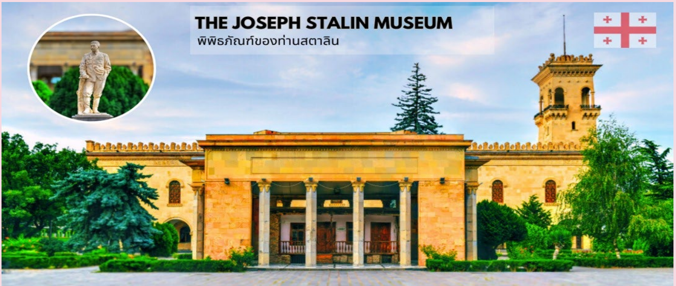
THE JOSEPH STALIN MUSEUM พิพิธภัณฑ์ของท่านสตาลิน

จากนั้นนำท่านเยี่ยมชม พิพิธภัณฑ์ของท่านสตาลิน (The Joseph Stalin Museum) ผู้นำคนสำคัญของสหภาพโซเวียต ซึ่งเป็นสถานที่รวบรวมเรื่องราวในวัยเด็ก และข้าวของเครื่องใช้ของท่านสตาลินเอาไว้ ของที่หาชมได้แค่นี้คือ เครื่องราชอิสริยาภรณ์แห่งเลนินของสตาลิน (Order of Lenin), death mask ของสตาลิน รวมไปถึงบ้านหลังจริงที่ท่านสตาลินเกิดและอาศัยในวัยเด็ก และที่นี่ยังมีการจัดโชว์ “โบกี้รถไฟ” หรือตู้รถไฟที่ท่านสตาลินใช้ในการเดินทางในสมัยที่ยังดำรงตำแหน่งผู้นำ ซึ่งตู้รถไฟนี้มีความพิเศษคือถูกทำขึ้นมาโดยเฉพาะ ภายนอกบุหุ้มด้วยเกราะกันกระสุนนั้น ทำให้ตู้รถไฟนี้มีน้ำหนักมากถึง 80 ตันเลยทีเดียว