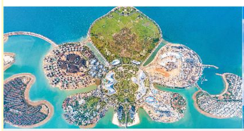
เกาะดอกไม้