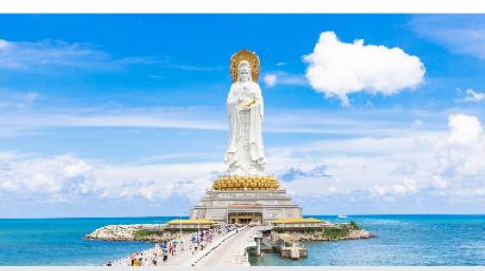
เจ้าแม่กวนอิมหนานชาน