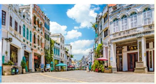
ถนนโบราณฉีไห่ลว

*ทางบริษัทฯ ขอสงวนสิทธิ์ในการสลับโปรแกรมทัวร์ตามความเหมาะสมขึ้นอยู่กับสถานการณ์ปัจจุบัน โดยคำนึงถึงผลประโยชน์ของลูกค้าเป็นสำคัญ