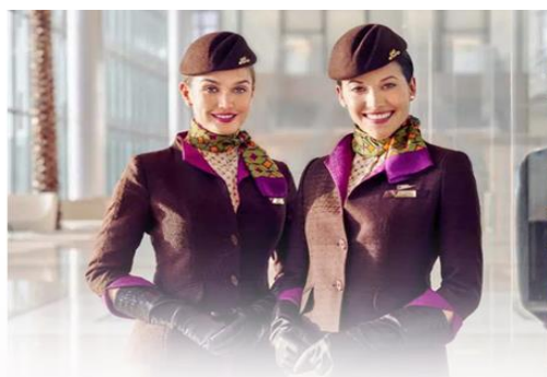
เดินทางโดยสารการบิน ETIHAD AIRWAYS (EY) น้ำหนักสัมภาระโหลดใต้ท้องเครื่อง 30 กก. / CARRY ON 7 กก.

** การันตี 15 ท่านออกเดินทาง พร้อมหัวหน้าทัวร์คนไทย **