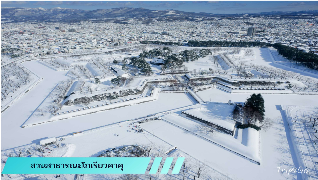
สวนสาธารณะโกเรียวกาคู

นำท่านสู่ ตลาดเช้าฮาโกดาเตะ (HAKODATE MORNING MARKET) ตลาดสดยามเช้าที่โด่งดังในหมู่นักท่องเที่ยวที่ตั้งอยู่ที่ เมืองฮาโกดาเตะ (Hakodate) นับเป็นตลาดยามเช้าที่ผู้คนต่างหลั่งไหลเข้ามาจับจ่ายซื้อของ ทั้งอาหารสดอาหารแห้ง ร้านขายของ ภายในตลาดเต็มไปด้วยร้านขายอาหารทะเลสด หรือจะเป็นผลไม้ต่างๆ ตามฤดูกาล ที่มีให้นักท่องเที่ยวได้เลือกซื้อกลับไปเป็นของฝากอีกเพียงจากนั้น เดินทางเข้าสู่ ป้อมปราการโกเรียวกาคู (GORYOKAKU) ตั้งอยู่ใจกลางเมืองฮาโกดาเตะ เมื่อมองจากการออกแบบห้าด้านแล้ว จะเห็นได้ชัดว่าเป็นป้อมปราการทรงดวงดาว เพราะป้อมปราการแห่งนี้ได้รับการออกแบบโดยทาเคดะ อะยะฮะฮะรุโระ และได้รับอิทธิพลทางการออกแบบจากเวาบัน วิศวกรทางทหารชาวฝรั่งเศสป้อมแห่งนี้คือป้อมปราการแห่งแรกในรูปแบบตะวันตกในประเทศญี่ปุ่น ป้อมแห่งนี้ได้สร้างเสร็จในปี ค.ศ.1864 (ราคาทัวร์ไม่รวมค่าลิฟต์ขึ้นชมหอคอย คนละประมาณ 800 เยน)