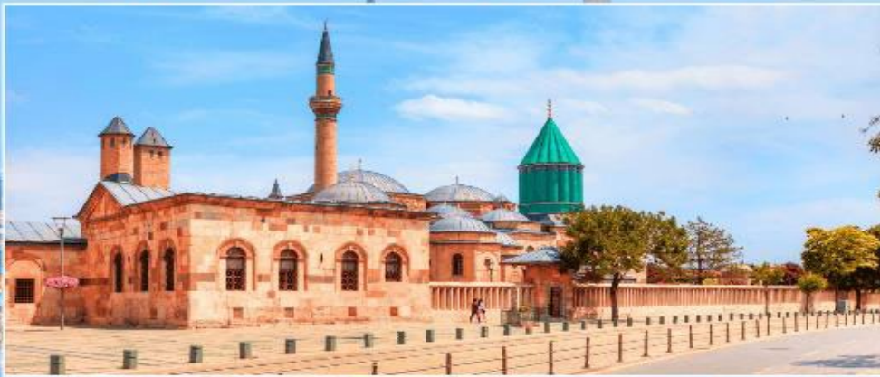
พิพิธภัณฑ์เมฟลานา KONYA

เย็น รับประทานอาหารเย็น ณ ห้องอาหารของโรงแรม ที่พัก ✈ MUSTAFA HOTEL หรือเทียบเท่า