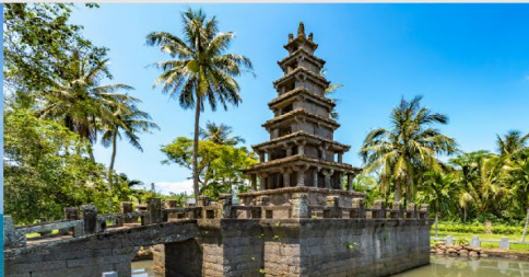
เจดีย์ 2 ชั้นนึ่งเหม่ยหลาน