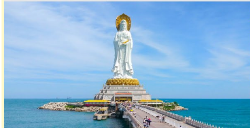
เจ้าแม่กวนอิมหนานชาน