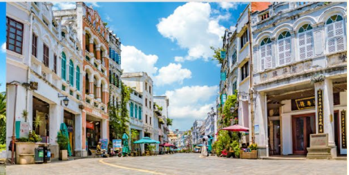
ถนนโบราณฉีโหลว

*ทางบริษัทฯ ขอสงวนสิทธิ์ในการสลับโปรแกรมทัวร์ตามความเหมาะสมขึ้นอยู่กับสถานการณ์หน้างาน โดยคำนึงถึงผลประโยชน์ของลูกค้าเป็นสำคัญ