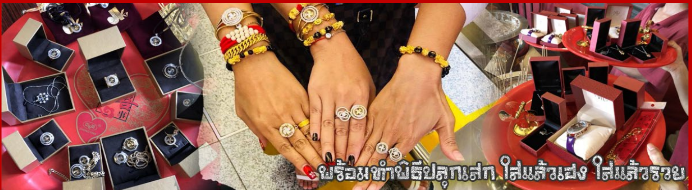
ชมพร้อมทำพิธีปลุกเสก ใส่แล้วรุ่ง ใส่แล้วรวย

จากนั้นนำท่านสู่ ร้านหยก ชมความงามปีเซี่ยะ ที่เชื่อกันว่าเป็นวัดกุ่มงดลยอดนิมย ที่มีการนำมาบูชา เพื่อให้ช่วยป้องกันสิ่งชั่วร้าย เรียกทรัพย์เงินทองให้ไหลมาเทมา และกักเก็บทรัพย์นั้นไม่ให้รั่วไหลออกไปไหนได้ ชาวจีนโบราณเชื่อกันว่า ปีเซี่ยะเป็นสัตว์ประหลาดที่รวมลักษณะของสัตว์มงคลทั้ง 5 ชนิดไว้ด้วยกัน ได้แก่ มังกร พญาราชาสีห์หรือสิงโต, อินทรี, กวาง, และแมว โดยตามตำนานเล่าว่า ปีเซี่ยะเป็นลูกมังกรตัวที่ 9 (เทพแห่งโชคลาภ) ของพญามังกรสวรรค์ มีชื่อเรียกด้วยกันหลายชื่อไม่ว่าจะเป็น “เทียนลก (กวางสวรรค์)” เป็นชื่อเดิม ส่วนจีนกวางตุ้งจะเรียกว่า “เผ่เย้า” และคนจีนแต้จิ๋วจะเรียกว่า “ผีซิว”