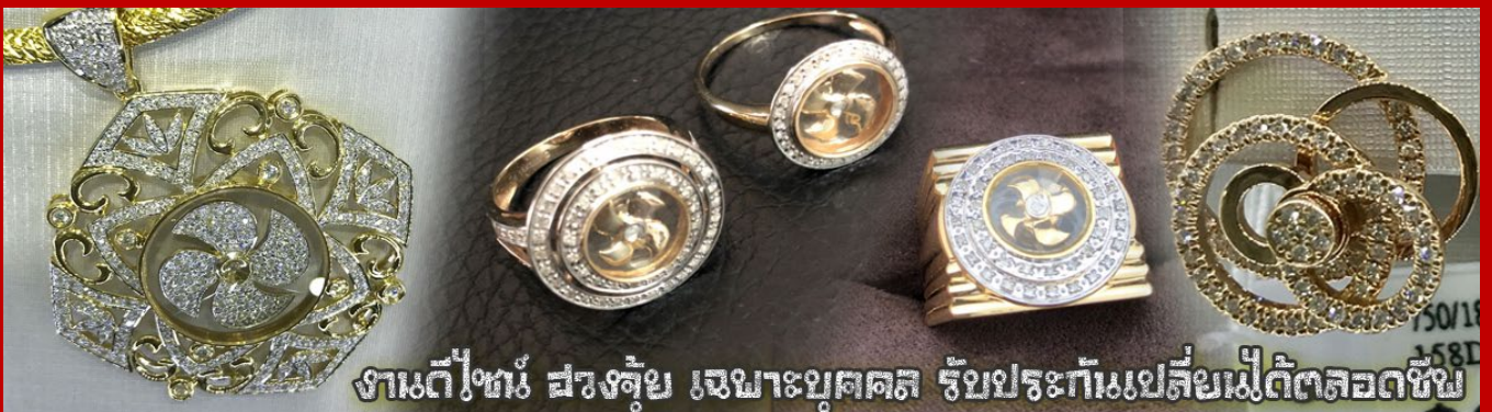
งานดี ๆ งาม สวย ชุ่ม งามาบุศตล รับประทักแม่สี่มเป็ดัดตลอดชีพ

นำท่านเยี่ยมชม โรงงานจิวเวลอรี่ ที่ขึ้นชื่อของฮ่องกงพบกับงานดีไซน์ที่ได้รับรางวัลอันดับยอดเยี่ยม และใช้ในการเสริมดวงเรื่อง ฮวงจุ้ยนำความโชคดี มั่งมั่งแก่ผู้สวมใส่ ซึ่งในเมืองไทยก็ได้นิยมแพร่หลายออกไป ไม่กว่าจะเป็นกลุ่ม ดารา นักการเมือง พ่อค้าแม่ขายที่ประกอบธุรกิจ เจ้าของกิจการห้างร้านต่าง ๆ ซึ่งเชื่อกันว่าจะนำสิ่งดี ๆ ปิดเป่าสิ่งชั่วร้ายให้กับบุคคลที่สวมใส่ ซึ่งจะมีมากมายหลายชนิด เช่น จี้กั๊กหัน แหวนรุ่งต่าง ๆ นาฬิกาข้อมือ (ซึ่งผู้สวมใส่จะได้รับการดูลายมือจากซินเซปประจำร้าน เพื่อนำวิธีการเสริมดวงในการสวมใส่โดยไม่ได้ติดค่าบริการ)