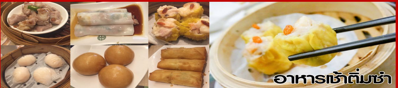
อาหารเช้าเต็มชาม

หลังจากนั้นขอพรเทพเจ้ากวนอู ณ วัดกวนไต่ วัดเก่าแก่สร้างขึ้นในปีพ.ศ. 2434 เป็นวัดเดียวในเกาลุนที่บูชาเทพ เจ้ากวนอูเป็นเทพผู้ยิ่งใหญ่ เทพเจ้าแห่งความซื่อสัตย์ โชคลาภ บารมี