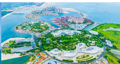
เกาะดอกไม้