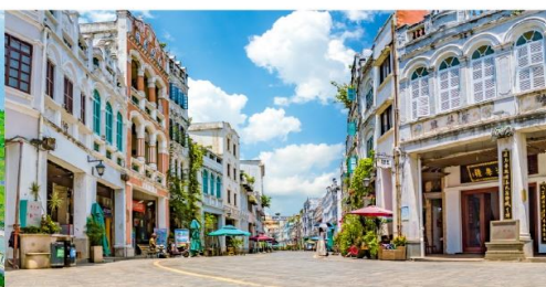
ถนนโบราณฉีหลว

*ทางบริษัทฯ ขอสงวนสิทธิ์ในการสลับโปรแกรมทัวร์ตามความเหมาะสมขึ้นอยู่กับสถานการณ์หน้างาน โดยคำนึงถึงผลประโยชน์ของลูกค้าเป็นสำคัญ