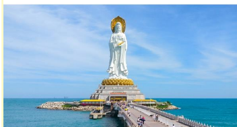
เจ้าแม่กวนอิมหนานซาน