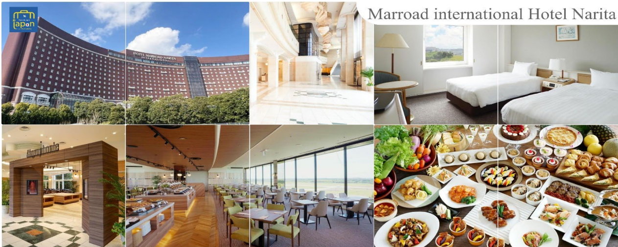
Marrod international Hotel Narita

เย็น อิสระรับประทานอาหารเย็นตามอัธยาศัย พักที่ MARROD INTERNATIONAL HOTEL NARITA หรือเทียบเท่าระดับเดียวกัน