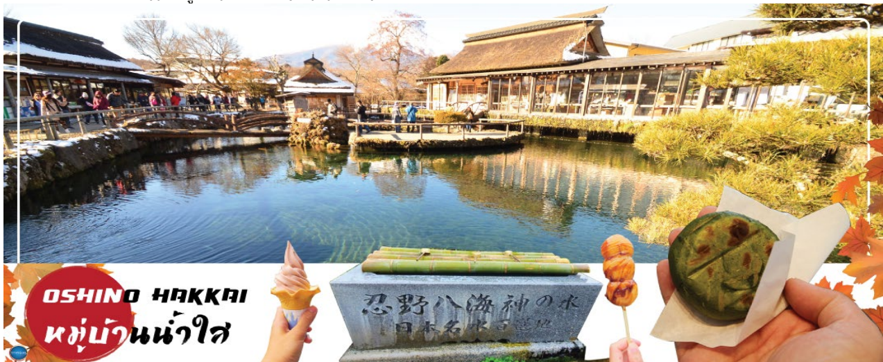
OSHINO HAKKAI หมู่บ้านน้ำใส

นำท่านชม หมู่บ้านโอชิโนะฮักไก (Oshino Hakkai) เป็นในช่วงฤดูใบไม้เปลี่ยนสีเป็นจุดท่องเที่ยวสำคัญอีกสถานที่หนึ่ง โดยมีวิวภูเขาไฟฟูจิสีขาวตัดกับพื้นหลังสีฟ้า และใบไม้เปลี่ยนสี สีเหลือง แดง ส้ม เป็นภาพที่สวยงามมาก โอชิโนะฮักไกเป็นหมู่บ้านเล็กๆ ประกอบด้วยบ่อน้ำ 8 บ่อในโอชิโนะ ตั้งอยู่ระหว่างทะเลสาบคาวากูจิโกะ กับทะเลสาบยามานาคาโกะ บ่อน้ำทั้ง 8 นี้เป็นน้ำจากหิมะที่ละลายในช่วงฤดูร้อน ที่ไหลมาจากทางลาดใกล้ภูเขาไฟฟูจิผ่านหินลาวาที่มีรูพรุนอายุกว่า 80 ปี ทำให้น้ำใสสะอาดเป็นพิเศษ นอกจากนี้ยังมีร้านอาหาร ร้านจำหน่ายของที่ระลึก และขนมรอบๆบ่อ ที่ขายทั้งผัก ขนมหวาน ผักดอง งานฝีมือ และผลิตภัณฑ์ท้องถิ่นอื่นๆ อิสระให้ท่านได้เพลิดเพลินกับการถ่ายรูปและซื้อของที่ระลึกตามอัธยาศัย