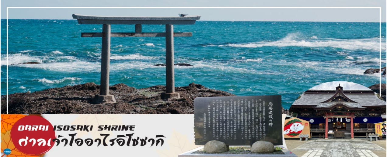
ORAI ISOSAKI SHRINE ศาลเจ้าโอรाइโซซากิ

ของเทพเจ้าโอนามุจิโนะมิโคโตะ และ เทพเจ้าสคุนะฮิโคะโนะมิโคโตะ สร้างขึ้นตั้งแต่ 29 ธันวาคม ค.ศ.856 รวมทั้งยังเป็นจุดถ่ายรูปพระอาทิตย์ขึ้นที่มีชื่อเสียง มีนักท่องเที่ยวมากมายมาเฝ้าคอยเพื่อเก็บภาพช่วงเวลาที่แสงตะวันสาดส่องขึ้นสู่ขอบฟ้า