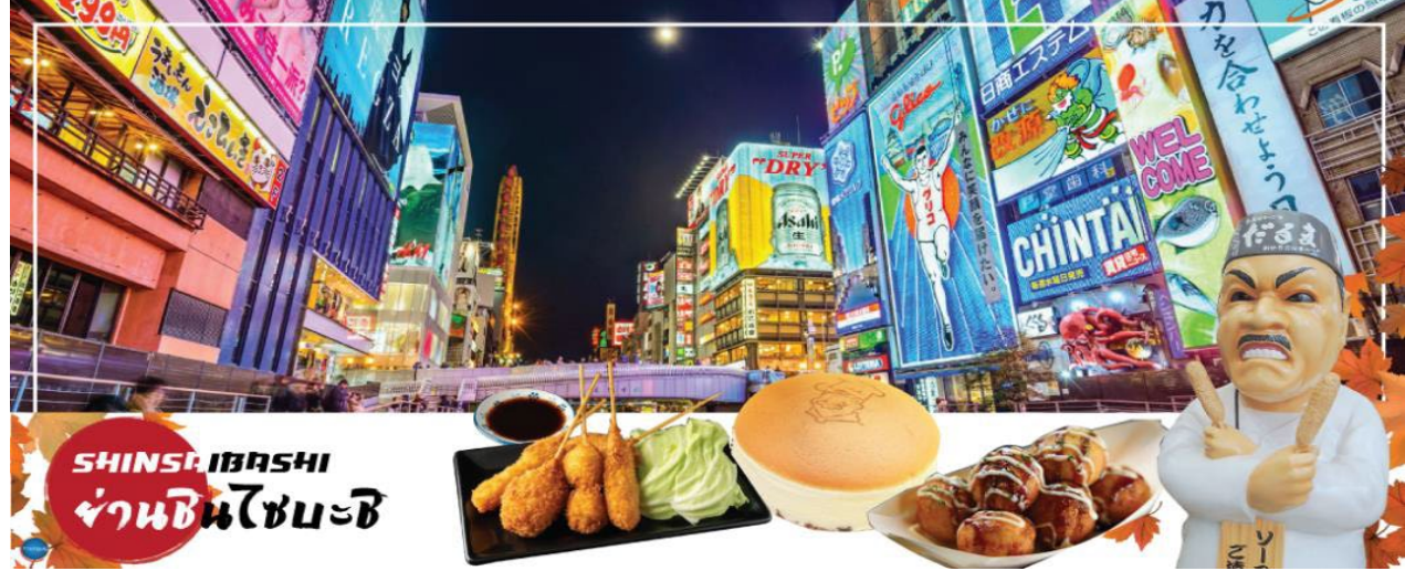
SHINSAIBASHI ย่านชินไซบาชิ