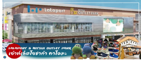
LALAPORT & MITSUI OUTLET PARK เอาท์เล็ตโอซาก้า คาโดมาะ

นำท่านสู่ LALAPORT & MITSUI OUTLET PARK OSAKA KADOMA มีกำหนดเปิดให้บริการในวันที่ 17 เมษายน 2023 ที่ผ่านมา ซึ่งถือเป็นสาขาใหม่ล่าสุดที่มีเอกลักษณ์ในญี่ปุ่น โดยปกติแล้วศูนย์การค้าและเอาท์เล็ตจะแยกกันคนละที่ ดังนั้น นี่จึงเป็นครั้งแรกที่เป็น การรวมศูนย์การค้าขนาดใหญ่เข้าด้วยกันกับ Outlet ขนาดใหญ่แห่งแรก ห้างสรรพสินค้าที่มีสิ่งอำนวยความสะดวกครบครันขนาดใหญ่ทั้งหมดถึง 4 ชั้น ที่ LaLaport คุณสามารถจับจ่ายสินค้าแฟชั่น อาหาร และของใช้ประจำวันอื่น ๆ และที่เอาท์เล็ต คุณจะพบสินค้าแบรนด์ทั้งในและต่างประเทศในราคาพิเศษที่จับต้องได้