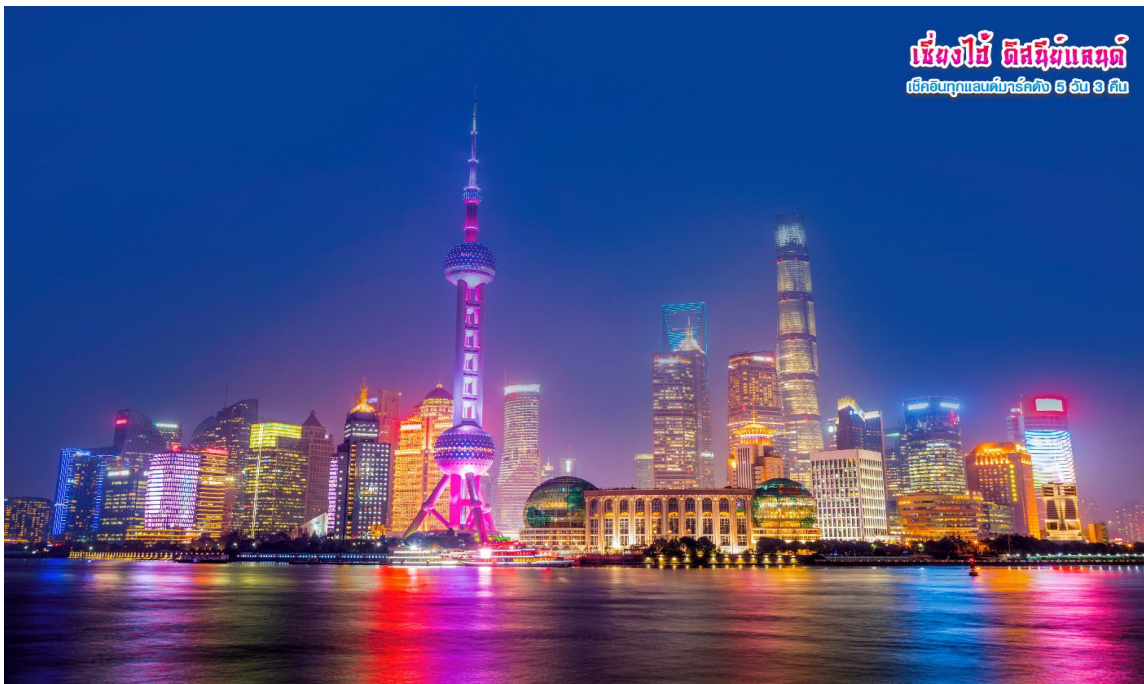
เซี่ยงไฮ้ ดิสคัฟเวอรีแลนด์ เปิดทุกวันเสาร์ที่บาร์คัว 9 โมง 9 โมง

จากนั้นนำท่านไปถ่ายรูป “หอไข่มุก” สัญลักษณ์ของเมืองเซี่ยงไฮ้ เป็นสถานีวิทยุที่ใหญ่ที่สุดในเซี่ยงไฮ้ มีความสูง 468 เมตร จำนวน 14 ชั้น หอไข่มุกถือเป็นหอคอยที่สูงที่สุดเป็นอันดับ 5 ของโลก และด้านบนตึกจะมีทั้งโรงแรม ร้านอาหาร ที่นอกจากจะใช้ในด้านการสื่อสารแล้ว ยังเป็นสถานที่ท่องเที่ยวที่ได้รับความนิยมมากที่สุดแห่งหนึ่งของเมืองอีกด้วย ในยามค่ำคืนหอไข่มุกจะเปิดไฟแสงสีสวยงามเป็นอย่างมากเหมือนอยู่ในโลกอนาคตเลยทีเดียว อีสาระให้ท่านได้ถ่ายรูป