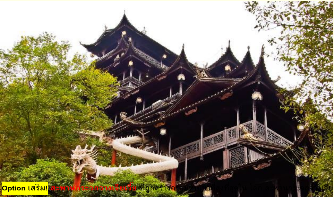
Option เสริม! สะพานกระงกจางเจียเจีย ที่ถูกสร้างขึ้นโดยชาวจีนโบราณ

นำท่านเดินทางสู่ เมืองโบราณวัฒนธรรมเผ่าตูเจีย เป็นเมืองโบราณแห่งเดียวที่ได้รับการอนุรักษ์ไว้อย่างดีในภูมิภาคตะวันตกเฉียงใต้ เป็นแหล่งกำเนิดและอารยธรรมโบราณของชาวตูเจีย นอกจากนี้ยังมีโบราณวัตถุล้ำค่าทางวัฒนธรรมจำนวนมากหลงเหลืออยู่ในเมือง ซึ่งรู้จักกันในชื่อ "พระราชวังต้องห้ามในภาคใต้" อาคารส่วนใหญ่เป็นโครงสร้างไม้และหิน มีการแกะสลัก คานและทาสีอาคารอย่างงดงาม