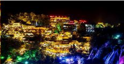
ฟูหรงเจิน