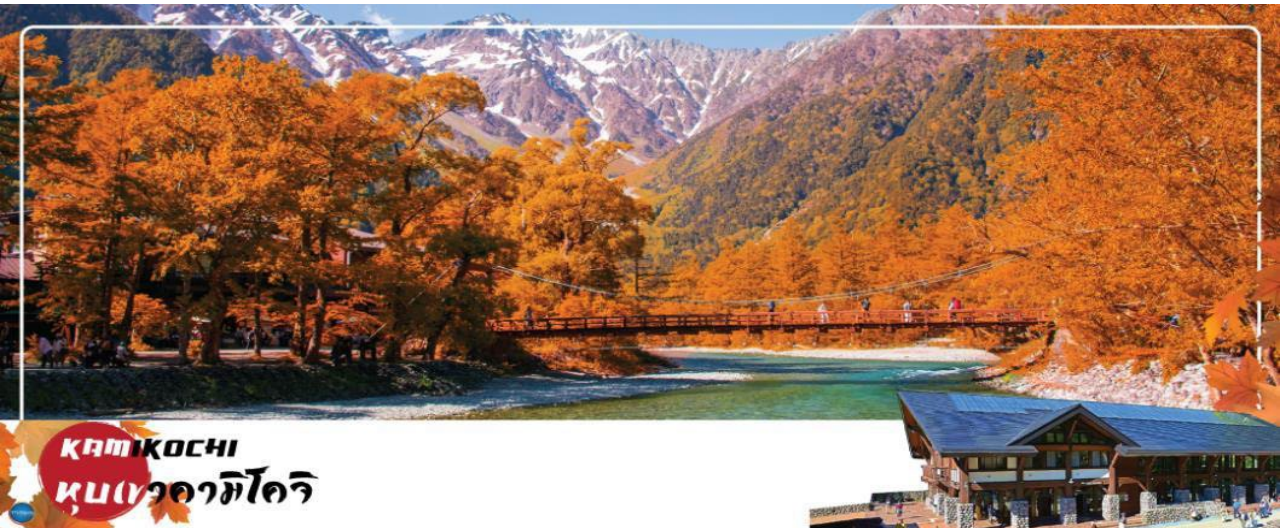
KAMIKOCHI หมู่บ้านดามิโคจิ

วันที่สี่ เมืองมัตสึโมโตะ – ปราสาทมัตสึโมโตะ(ด้านนอก) – เมืองนากาโนะ – ดามิโคจิ – สะพานกัปปะ – เมืองเซกิ – พิพิธภัณฑสถานแห่งชาติ – เมืองนาโกย่า – ซ้อปิ้งย่านชาคาเอะ