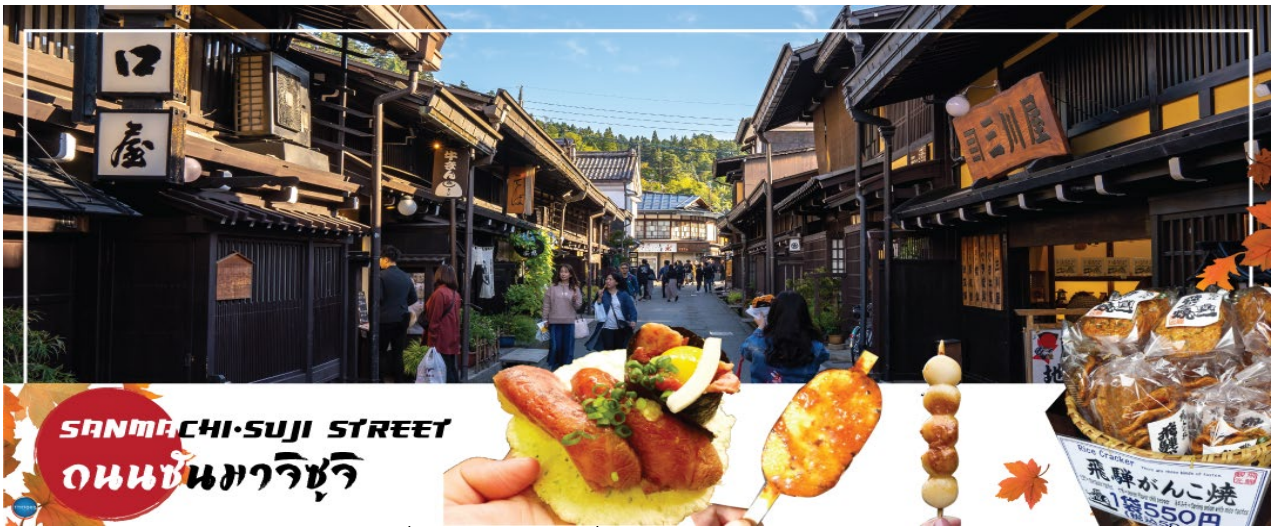
SANMACHI-SUJI STREET ถนนซันมาจิซุจิ

จากนั้นนำท่านสู่ หมู่บ้านมรดกโลก ชิราคาวาโกะ (Shirakawa-go) เมืองที่เป็นมรดกโลกทางวัฒนธรรมของประเทศญี่ปุ่น เป็นหมู่บ้านชาวนาที่มีรูปร่างแปลกตาติดอันดับ The most beautiful village in Japan และเป็นเมืองมรดกโลกที่มีชื่อเสียงแห่งหนึ่ง ไฮไลท์!! หมู่บ้านแบบกัสโชสึคิ เป็นบ้านชาวนาโบราณที่มีอายุมากกว่า 250 ปี คำว่า กัสโช มีความหมายว่า พนมมือ ซึ่งเป็นการบ่งบอกถึงลักษณะ รูปแบบของบ้านที่มีหลังคามุงด้วยฟางข้าวที่ทำมุมชันถึง 60 องศา คล้ายสองมือที่ประนมเข้าหากัน ตัวบ้านมีความยาวประมาณ 18 เมตร กว้าง 10 เมตร ทั้งหลังถูกสร้างขึ้นโดยไม่ใช้ตะปู ต่อมา ในปีค.ศ. 1995 องค์การยูเนสโกขึ้นทะเบียนให้ชิราคาวาโกะเป็นมรดกโลก จากนั้นออกเดินทางสู่ เมืองทาคายามะ (Takayama) จังหวัดกิฟุ เมืองเล็กๆ ที่โอบล้อมไปด้วยภูเขาและธารน้ำใสจำนวนมาก อบอุ่นไปด้วยแหล่งประวัติศาสตร์และวัฒนธรรมอันอุดมสมบูรณ์ (ใช้เวลาเดินทางประมาณ 1 ชั่วโมง) อีกระให้ท่านเดินเล่น ถนนซันมาจิซุจิ (Sanmachi-Suji Street) ซึ่งถูกขนานนามว่าเป็น ลิตเติ้ลเกียวโต หรือ เกียวโตน้อย