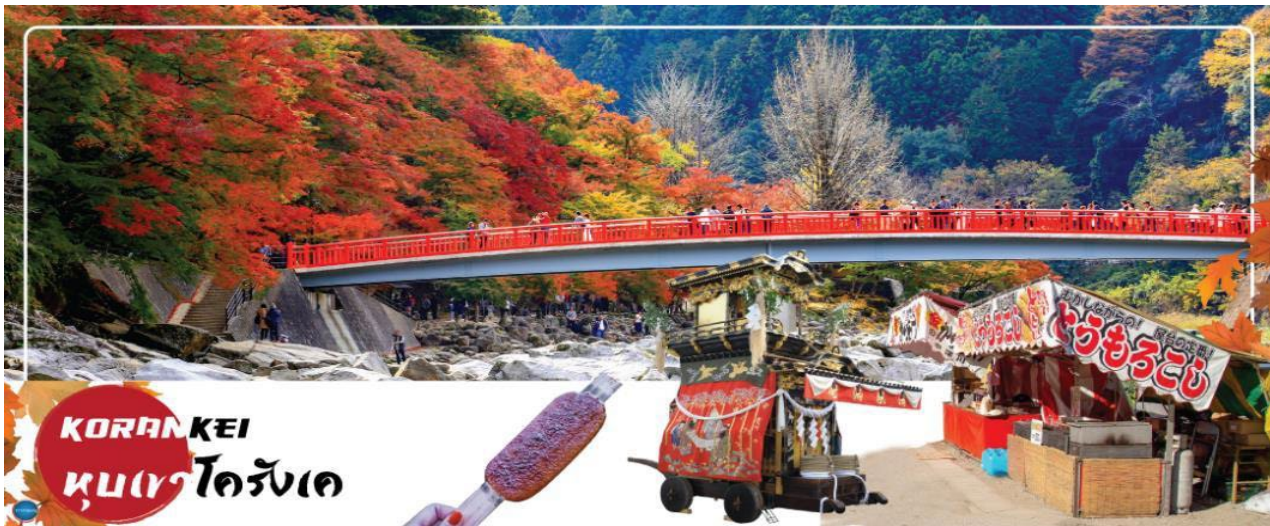
KORANKEI หุบเขาโคริงเค

เมืองนาโกย่า – หุบเขาโคริงเค – เมืองเกียวโต – การเรียนพิธีชงชาญี่ปุ่น – เมืองโอซาก้า – ช้อปปิ้งชินไซบาชิ