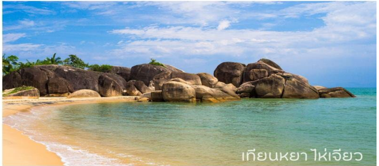
เทียนหย่าไห่เจียว