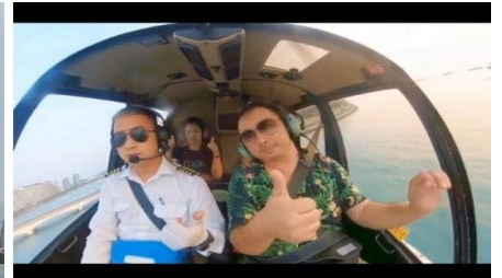
ดั่งภาพฝัน (รวมค่าขึ้นเฮลิคอปเตอร์)

หมายเหตุ** ใช้เวลาในการนั่ง โดยสาร ประมาณ 1 นาทีต่อรอบ และจำกัดผู้โดยสารครั้งละไม่เกิน 3 ท่าน โดยที่มีน้ำหนักรวมทั้งหมดไม่เกิน 200 กก.