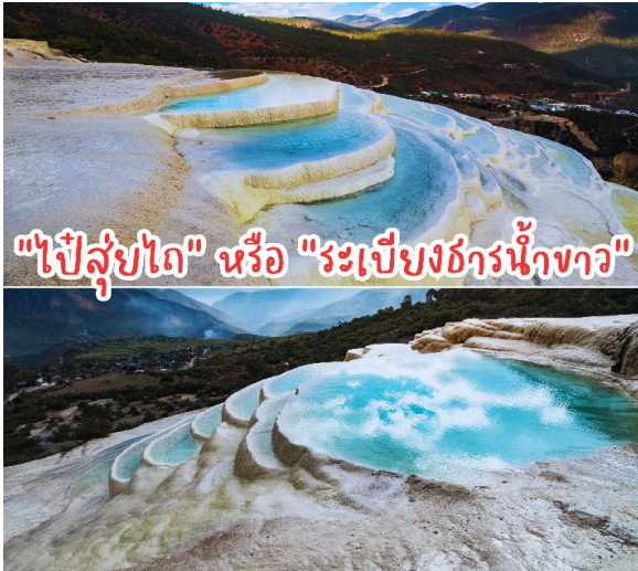
"ไป๋ส่วยโต" หรือ "ระเบียงธารน้ำขาว"

นำท่าน สู่เมืองลี่เจียง ระหว่างทางชม ชวนชมธรรมชาติอันงดงามของ "ไป๋ส่วยโต" หรือ "ระเบียงธารน้ำขาว" ซึ่งตั้งอยู่บนความสูงเหนือระดับน้ำทะเล 2,380 เมตร และครอบคลุมพื้นที่ประมาณ 3 ตารางกิโลเมตร ในตำบลซานป้า เมืองเซียงเก้อหลี่ลาหรือแซงกรีลา มณฑลยูนนาน (ยูนนาน) ทางตะวันตกเฉียงใต้ของจีนระเบียงธารน้ำขาวแห่งนี้ก่อตัวขึ้นจากการตกสะสมตัวของแคลเซียมคาร์บอเนตในน้ำที่ไหลจากน้ำพุ สร้างเป็นทิวทัศน์ความมหัศจรรย์ทางธรรมชาติจวบจนปัจจุบัน ทั้งยังได้รับสมญานามว่า "สถานที่ที่เมฆขาวทิ้งร่องรอยบนโลกา"