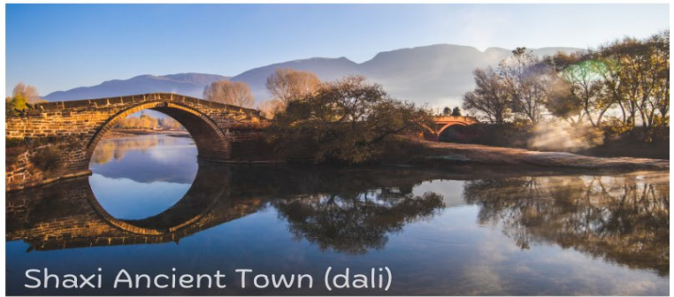
Shaxi Ancient Town (dali)