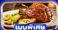
เมนูพิเศษ ขาคูเยอรมัน

อิตาลี ขึ้นกระเช้าสู่ยอดเขาแอลปี ดี ซูเซ่ สัมผัสความอลังการของเทือกเขาโดโลไมท์ ชมทะเลสาบมิซูริน่า มหาวิหารดูโอโมแห่งมิลาโน ช้อปปิ้งศูนย์การค้าที่เก่าแก่ที่สุดในโลก ออสเตรีย หลังคาทองคำ พระราชวังฮอฟบวร์ก มหาวิหารอินส์บรุค เยอรมัน ปราสาทนอยชวานสไตน์ ฟุสเซินเมืองลูกกวาด มิวนิก จัตุรัสมาเรียนพลัทซ์ มหาวิหารเฟราเออน ช้อปปิ้งเอาท์เล็ตแบรนด์ชั้นนำ