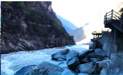
ช่องแคบเลือกระโจน