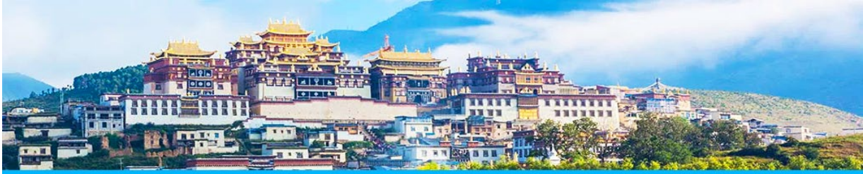
เมืองโบราณแซงกริล่า

จากนั้นนำท่านชม หมู่บ้านชีโจวหรือหมู่บ้านชาวไป๋ ชนพื้นเมืองที่สำคัญของเมือง ชมการแสดงของชนชาติป๋ายพร้อมชิมชาสามแก้ว เพื่อรำลึกถึงวิถีชีวิตและการเกิดมาเป็นมนุษย์ของตนเอง ซึ่งถือเป็นเอกลักษณ์ของชนชาวไป๋ ที่หาดูได้ยาก