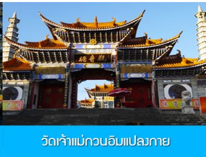
วัดเจ้าแม่กวนอิมแปลงกาย