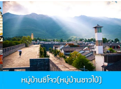
หมู่บ้านซีโจว(หมู่บ้านชาวป๋าย)

วันที่สอง ต้าหลี่-เมืองโบราณต้าหลี่-วัดเจ้าแม่กวนอิม-หมู่บ้านซีโจว-จงเตี้ยน-เมืองโบราณแชงกรีล่า