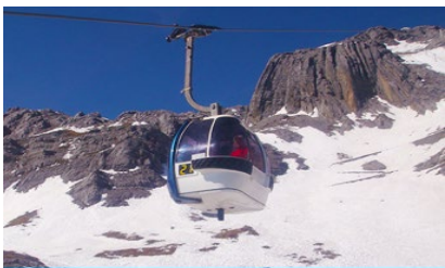
ภูเขาหิมะมังกรหยก (น้ำกระช้ำใหญ่)

ที่พัก FENG HUANG HOTEL ระดับ 4 ดาว หรือเทียบเท่าเมืองลี่เจียง