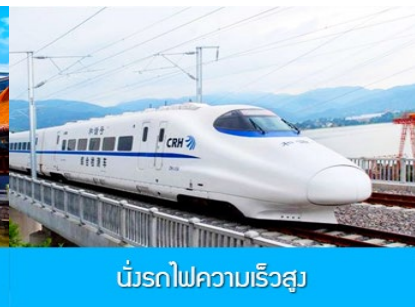
ขบวนรถไฟความเร็วสูง