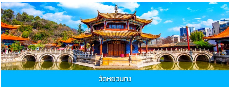
วัดหยวนกง