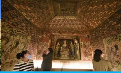
ชมภาพยนตร์ 3 มิติ