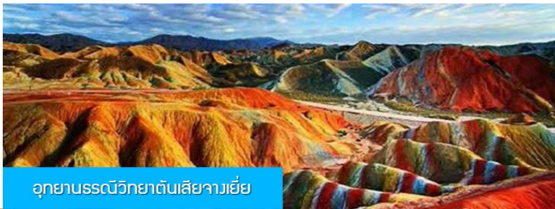
อุทยานธรณีวิทยาตันเสี่ยจางเยี่ย

พักที่ JIN WU INTER HOTEL โรงแรมระดับ 4 ดาวห้องดีน หรือเทียบเท่าในเมืองหู่เว่ย