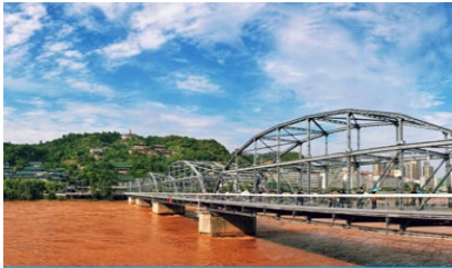
สะพานข้ามแม่น้ำฮวงโห