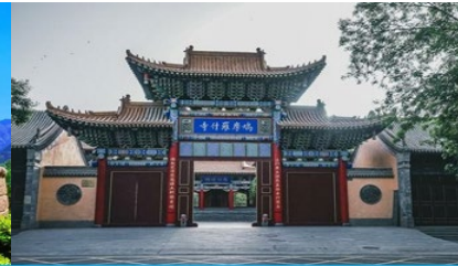
วัดจิวหม่วหลัวลือ