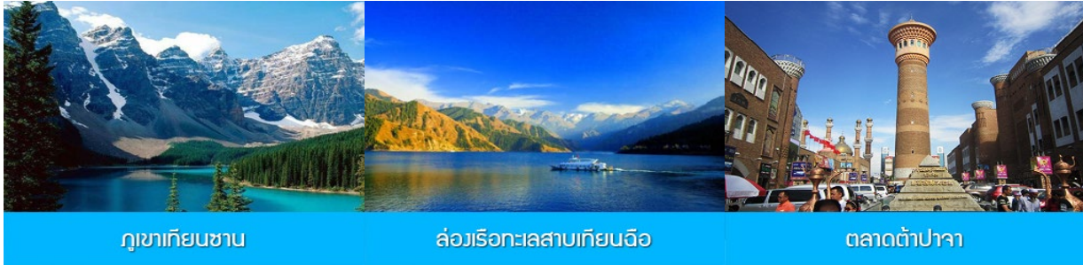
ภูเขาเทียนชาน