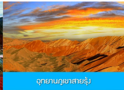
อุทยานภูเขาสายรุ้ง

วันที่สาม เมืองจางเยี่ย – เที่ยวชมอุทยานธรณีวิทยาตันเสี่ยจางเยี่ย - อุทยานภูเขาสายรุ้ง–เดินทางสู่เมืองเจียยวี่กวน