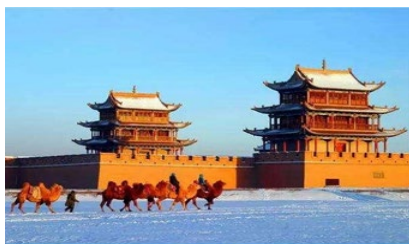
ด่านเจียชวีกวน

พักที่ REZEN HOTEL ระดับ 4 ดาวห้องดีนหรือเทียบเท่าในเมือง เจียชวีกวน