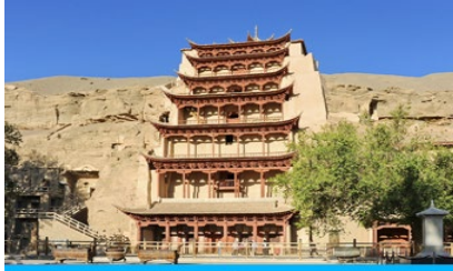
ถ้ำหินมั่วเกาคุ

พักที่ METRO PARK HOTEL โรงแรมระดับ 4 ดาวหรือเทียบเท่าในเมืองคุนหวง