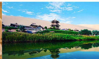
สระน้ำวงพระจันทร์