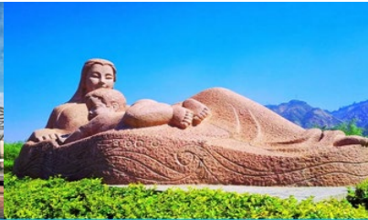
หินแกะสลักมารดาแม่น้ำฮวงโห